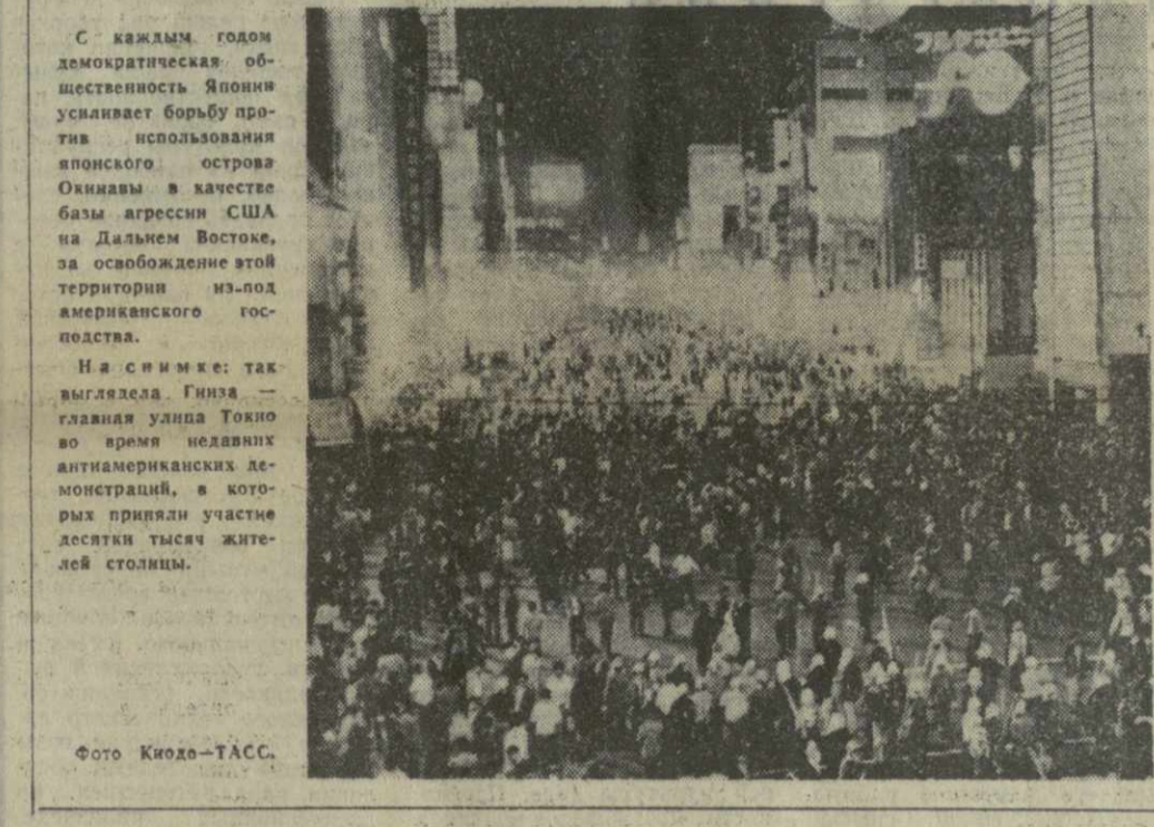
С каждым годом демократическая общественность Японии усиливает борьбу против использования атомной энергии в качестве базы агрессии США на Дальнем Востоке, за освобождение этой территории из-под американского господства.

В конце 1968 года я приобрел в магазине № 8 «Тбилис» мебель в кредит. Радость по поводу покупки новой мебели постепенно угасала в нашей семье. Мебель оказалась бракованной, и за четыре месяца полностью пришла