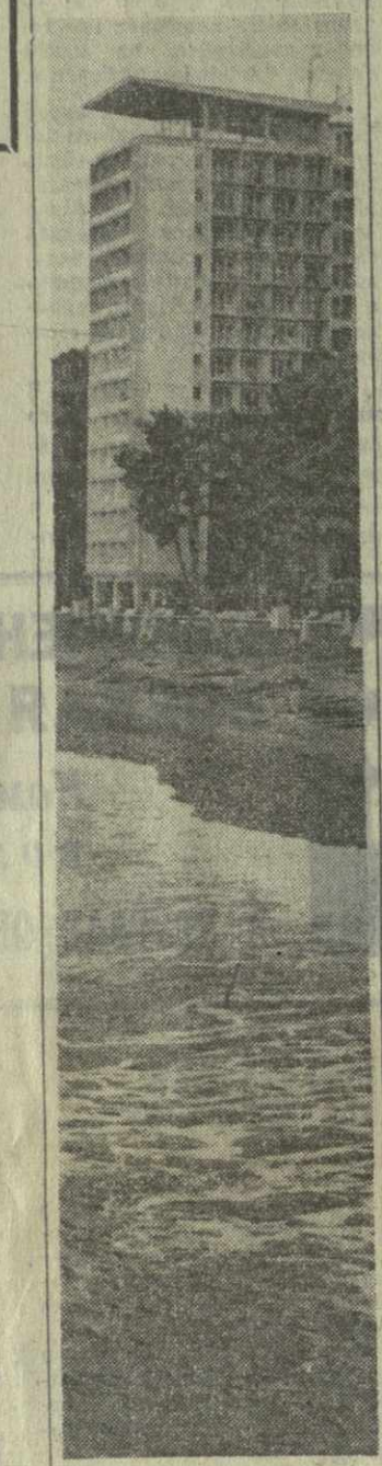
Курорт Пиндунд. Здесь расположена одна из красивейших зданций нашей республики. Сюда ежегодно приезжают десятки тысяч отдыхающих.