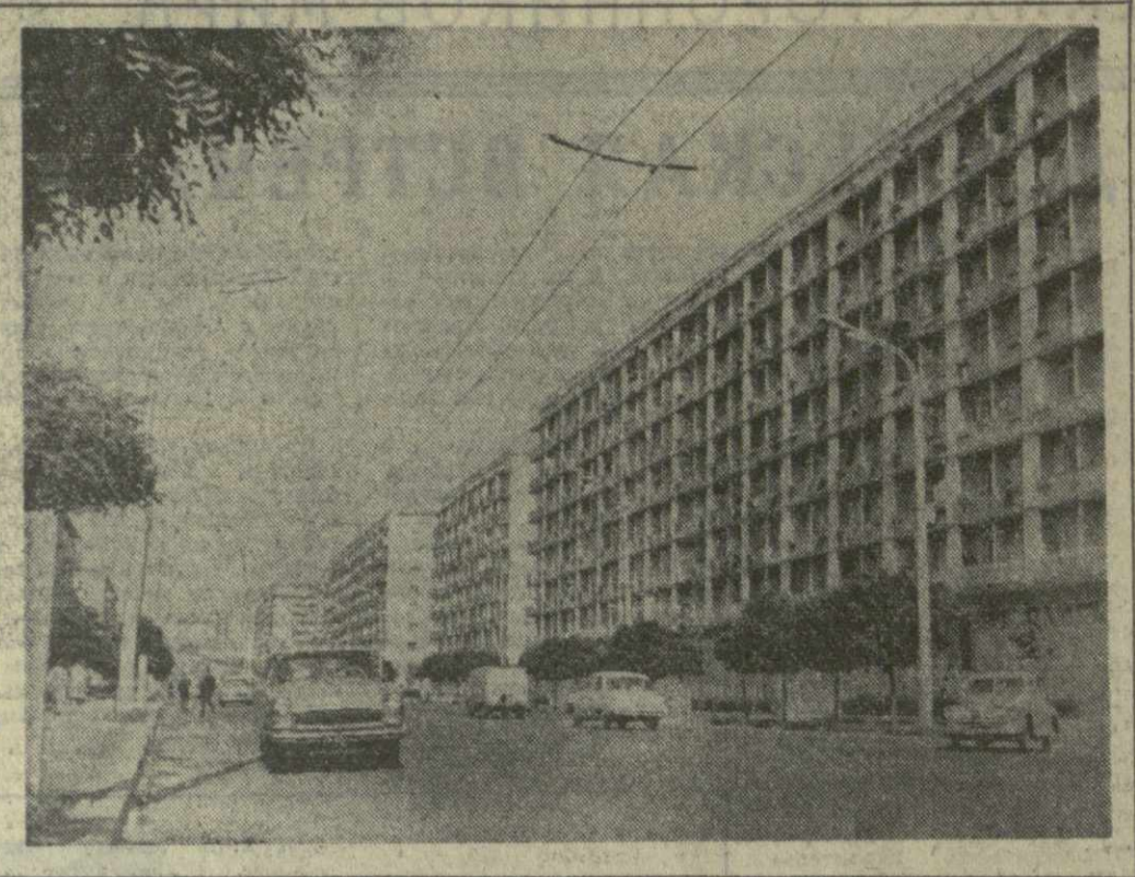
ТБИЛИСИ. Проспект Важа Пшавела.