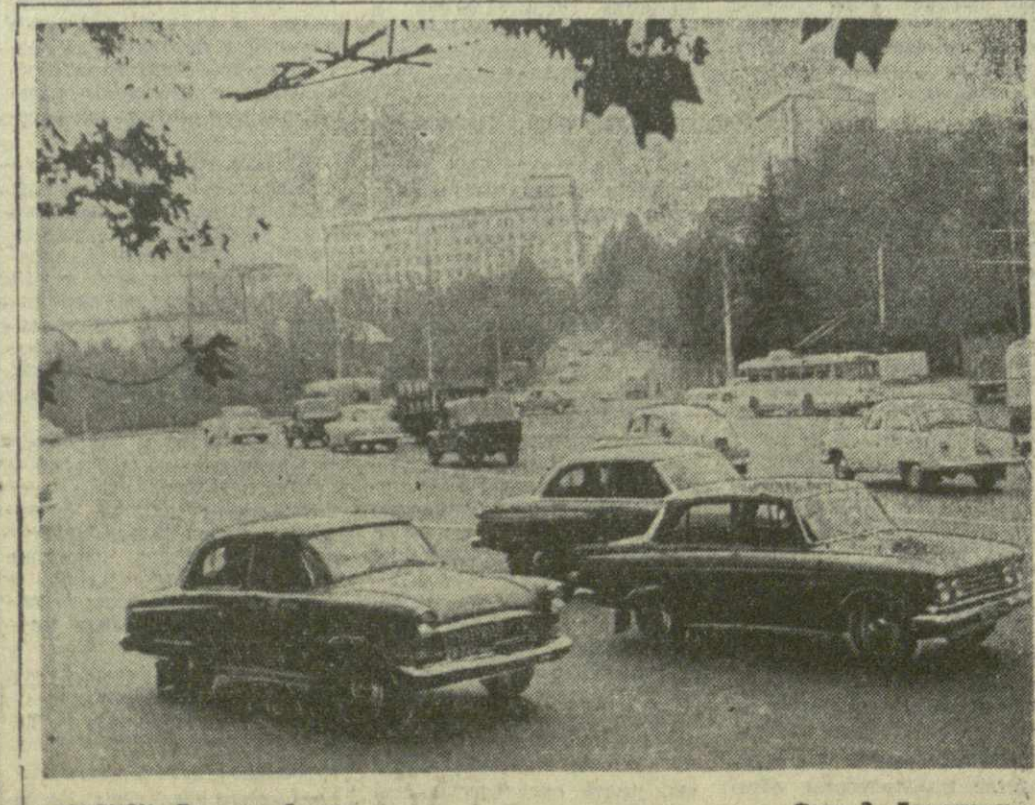
ТБИЛИСИ. Площадь Героев.