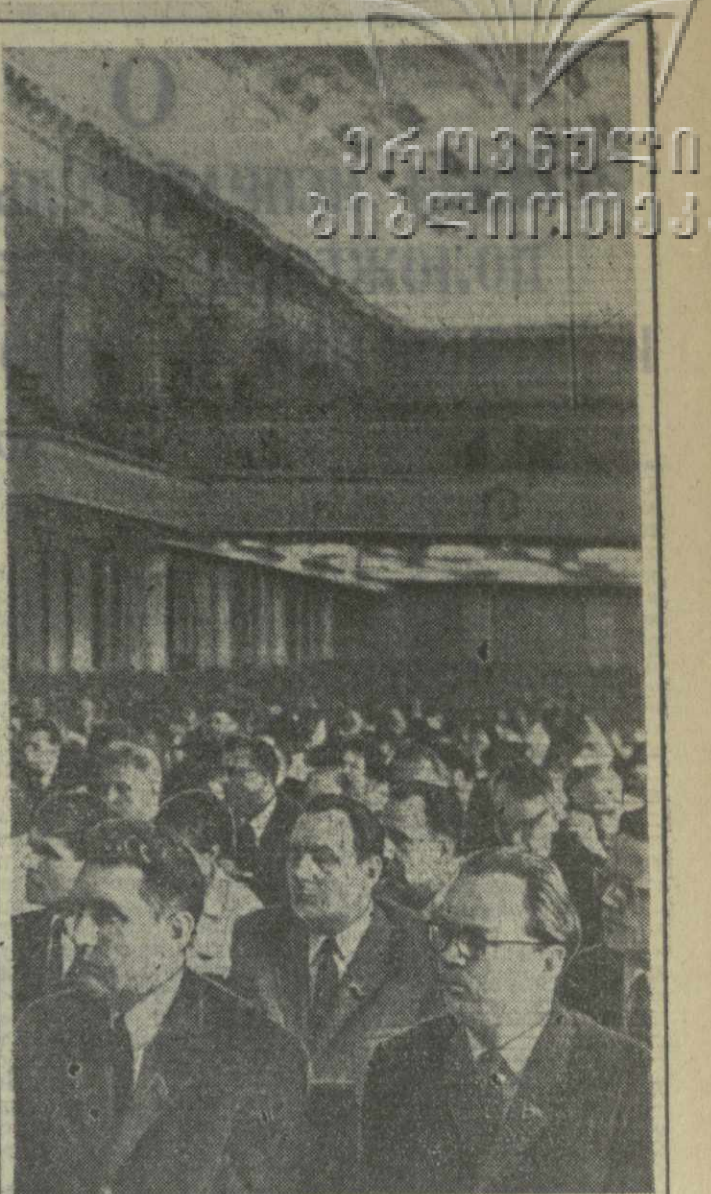
МОСКВА. 10 июля 1969 года. Шестая сессия Верховного Совета СССР седьмого созыва.