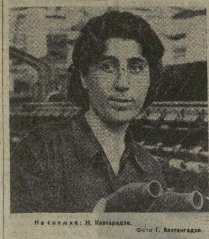
На снимке: Н. Кавтарадзе.

ОРГАН ЦК КП ГРУЗИИ, ВЕРХОВНОГО СОВЕТА ГРУЗИНСКОЙ ССР И СОВЕТА МИНИСТРОВ ГРУЗИНСКОЙ ССР 1969 год 13 ИЮЛЯ, ВОСКРЕСЕНЬЕ • № 160 (13411) • 48-й год издания • Цена 2 коп.