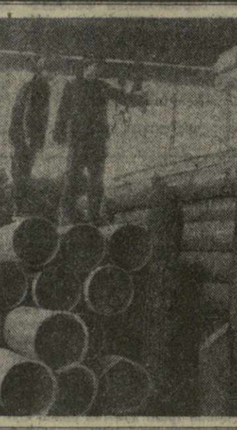
На Руставском ме- таллургическом за- воде впервые в Со- ветском Союзе внедрен в производ- ство новый метод, который в десять раз повышает стой- кость труб.

В Тбилисском универите- те мне рассказали, что в этом году отсев на экономи- ческом факультете составил около 15 человек. Они не сдали первую же сессию, оказавшись им не по сил- ам. Посчитайте, сколько на этом потеряло государство, если каждый студент обо- щится примерно 1.150 ру- блей в год. А сколько в гор- де высших учебных заведе- ний, а в республике, а в стране? Цифра получится