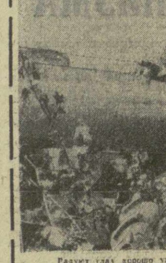
Радуются глазу хорошо ухоженные шестистоткратные плантации бархатистого винограда совхоза Гарабаевского района. В этом году коллектив совхоза обязался получить с каждого из 600 гектаров 60 центнеров винограда. Слева: механизаторы хозяйства ведут очередное лечение виноградника раствором негало купороса, проводят опыление души сорняков. И в сию же минуту бригады Ревва Барбакадзе (справа) дает задание механизаторам совхоза Шота Давиташвили.