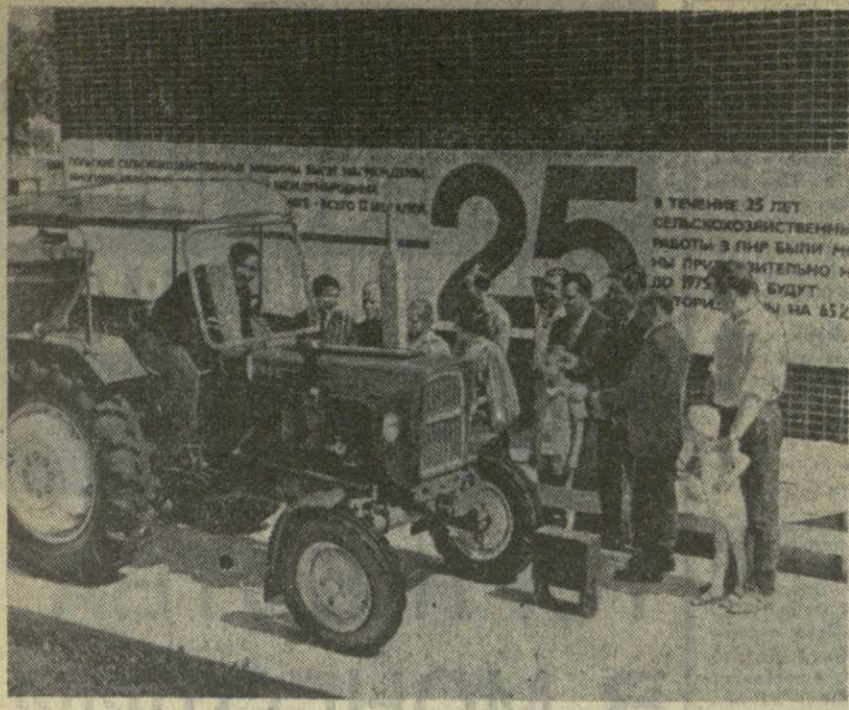
На снимке: в разделе сельскохозяйственных машин юбилейной промышленной выставки «25 лет Польской Народной Республики».

В эти дни в Москве, над одним из павильонов Выставки достижений народного хозяйства СССР развивается флаг Польской Народной Республики. Здесь с огромным успехом проходит юбилейная промышленная выставка «25 лет Польской Народной Республики».