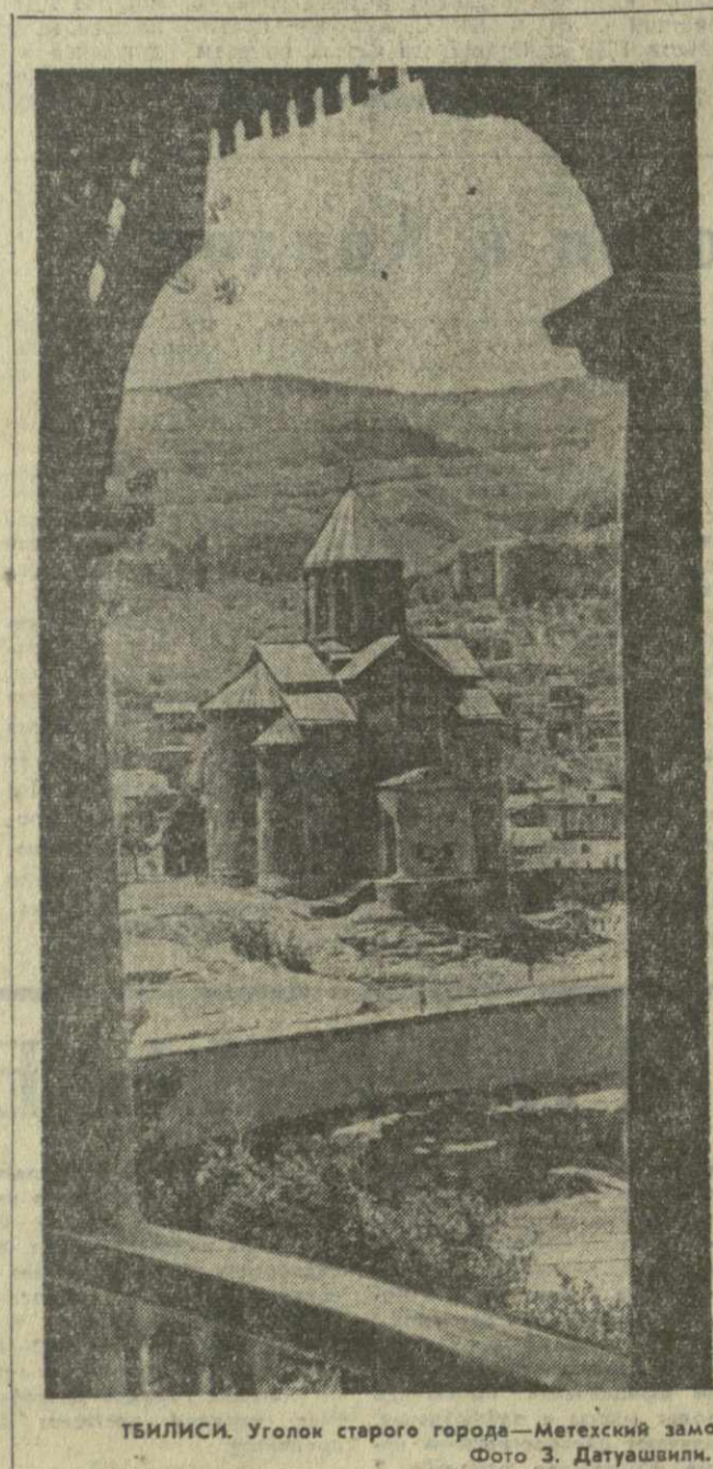
ТБИЛИСИ. Уголок старого города — Метехский замок.

Человек человеку — друг, товарищ и брат. Эти слова из морального кодекса строителей коммунизма стали девизом жизни советских людей.