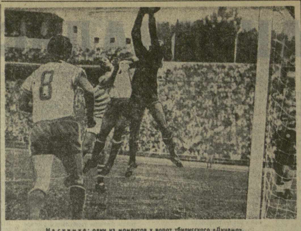
На снимке: один из моментов у ворот тбилисского «Динамо».