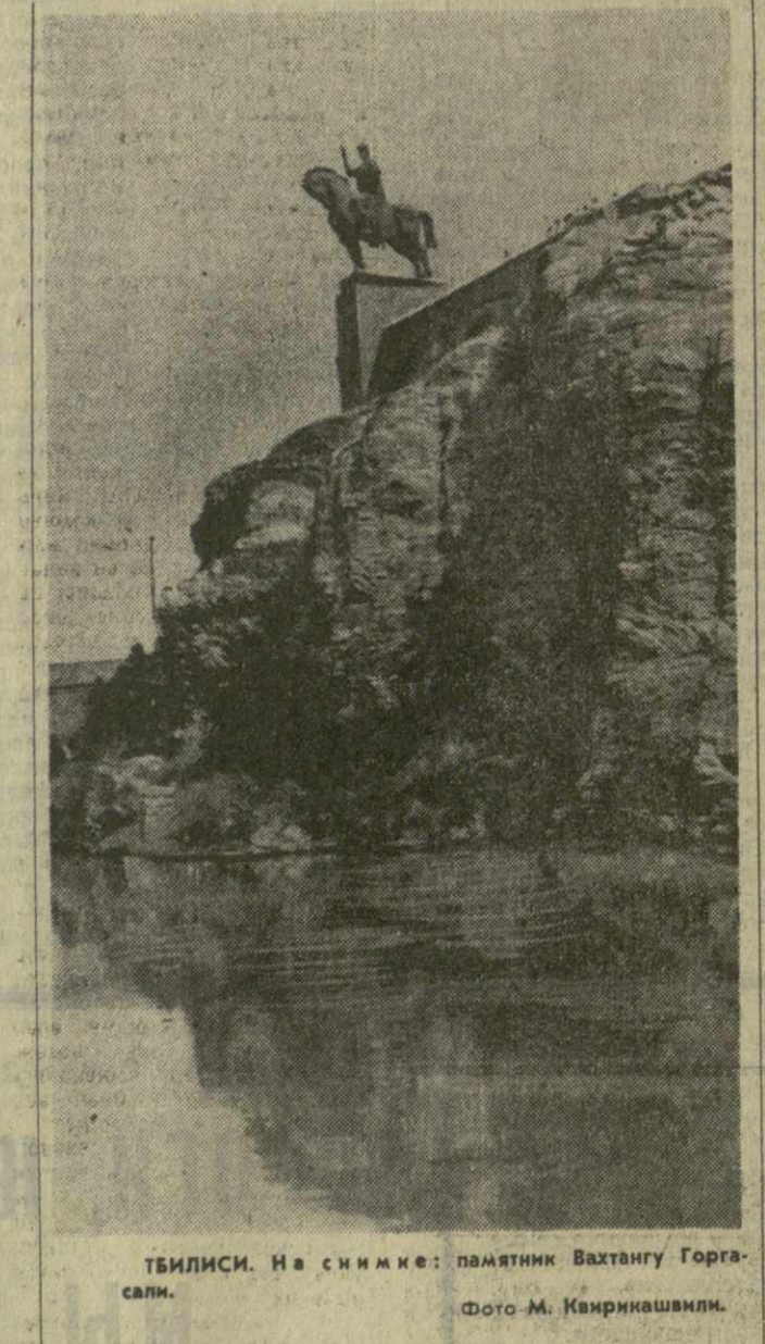
ТБИЛИСИ. На снимке: памятник Вахангу Горга-сали.