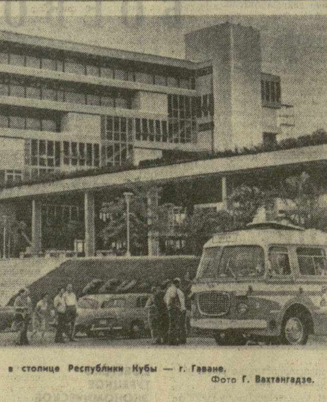
На снимке: университет в столице Республики Кубы — Гаване. Фото Г. Вакхангадзе.

НЬЮ-ЙОРК. 24 июля. (ТАСС). Сегодня — завершающий день полета космического корабля «Аполлон-11». Корабль быстро приближается к Земле, увеличивая скорость под влиянием земного притяжения. Самочувствие космонавтов хорошее. Отмечается, что за все время полета ни один из них не принимал медикаментов. Космонавты время от времени чистят каюту с помощью пылесоса для удаления лунной пыли, которую они могли занести в командный отсек. Примерно в 2 часа прошлой ночью был проведен последний телевизионный сеанс с борта корабля, продолжавшийся 15 мин. «Аполлон-11» находился в это время на расстоянии 170 тыс. км. от Земли. Космонавты показывали вид Земли из иллюминатора отсека и друг друга. Сегодня утром космонавты начали последний период отдыха на борту корабля, который продлится 7 часов. После него космонавты начнут готовиться к входу в плотные слои земной атмосферы и последующему приводнению в Тихом океане. В связи с тем, что согласно метеопрогнозу, в первоначально выбранном месте посадки ожидаются тропические ливни, принято решение перенести место приводнения «Аполлона-11» на 400 км. к северу, где метеорологические условия будут более благоприятными. Время посадки 19 часов 49 мин.