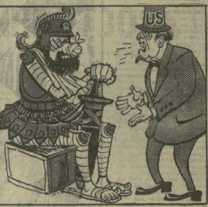
ПЕНТАГОН ТИШЕНО ВЗЫМАЕТ К БОЮ ВОЙНЫ МАРСУ. Рис. Г. Ломидзе.

Вашингтон, израсходовав на войну во Вьетнаме фантастическую сумму — около 100 миллиардов долларов. Но даже такой огромный затрат достигнуть цели ему не удастся. (Из газет).