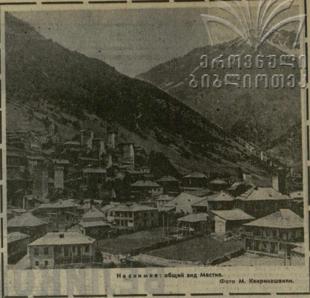
На снимке: общий вид Мestia.

Сравните также цифры — здесь, за облаками, они повторяют последние живые языком. В 1921 году в Сванетии был один-единственный врач и ни одной больницы. Сегодня в двух районах — Местийском и Лентехском — сотни врачей, десятка и фельдшерско — акушерских пунктов, бальнеологический курорт. В лечебных учрежде-