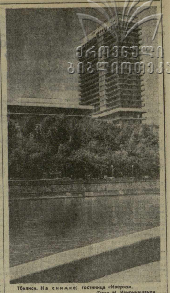
Тбилиси. На снимке: гостиница «Иверия».

Они спустились с гор... На крупнейшей в республике стройке — ИнгуриГЭС трудятся посланцы Сванетии. На снимке: монтажники Я. Шаговили и И. Гиоргобани.