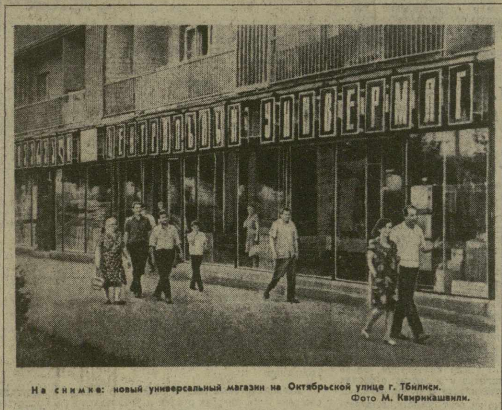
На снимке: новый универсальный магазин на Октябрьской улице г. Тбилиси.

ми, Сухуми, Рустави, Телави открылись благоустроенные десные универсамы. В начале проспекта Руставели в Тбилиси сейчас строится многоэтажный универсальный магазин на 450 рабочих мест. Это здание не только станет крупным торговым центром, но и будет отличным архитектурным сооружением, которое очень украсит город.