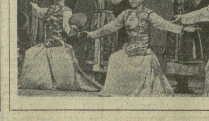
Улицы Батора. В Монголии бережно хранят и развивают народные традиции танцевального искусства. В дни праздников и отдыха трудящихся на улицах клубов, домов культуры и театров выступают артисты самодеятельных и профессиональных коллективов.

Национальная федерация женщин Индии опубликовала открытое письмо президенту США. Федерация протестует против агрессии США во Вьетнаме, требует предоставить вьетнамскому народу право самому решать свою судьбу, без вмешательства извне.