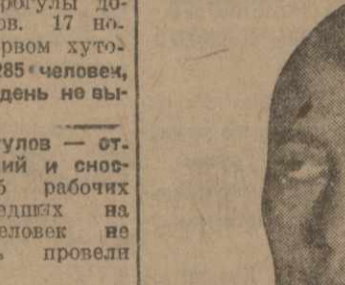
Рабочее питание организовано плохо. 10 ноября на центральном хуторе половина рабочих осталась без ужина