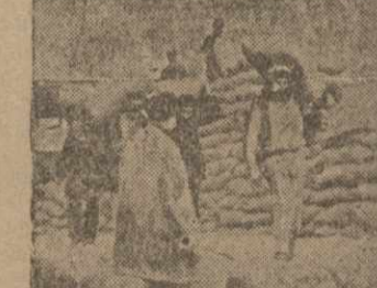
БОРЧАЛО. Отправка хлопка на сккупку

ТОКИО, 24. (ЗТА). Японское агентство Симсун ретко сообщает на Мукден, что атмосфера в районе Цзиньчжоу настолько напряжена, что столкновение между японскими и китайскими войсками неизбежно.