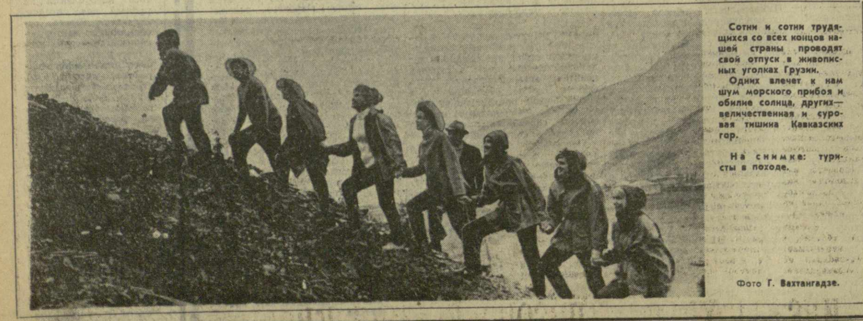
На снимке: туристы в походе.

Горькая станция юных техников объединяет 140 учащихся. Станция во главе молодых людей пробудила любовь к технике. Четыре шедевра юных техников Горьковской право участвуют в павильоне «Народное образование» Выставки достижений народного хозяйства СССР.