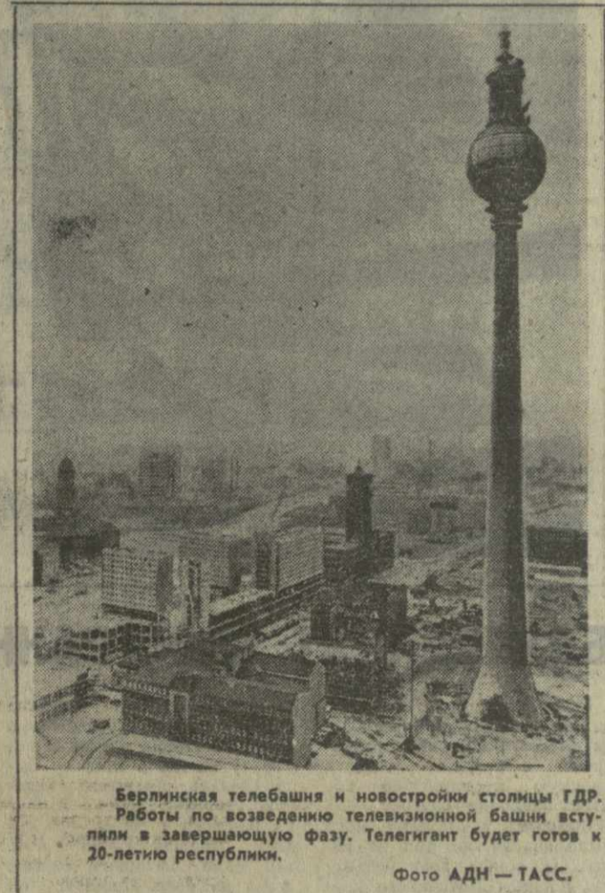
Берлинская телебашня и новостройки столицы ГДР. Работы по возведению телевизионной башни углубили в завершающую фазу. Телегигант будет готов к 20-летию республики.

Империалисты хорошо знают силу международной пролетарской солидарности: поэтому они в борьбе против сил социализма делают ставку на национализм, рассчитывая с его помощью раздробить коммунистическое движение и противопоставить национальные революционные отряды друг другу. Революционная империалистическая пропаганда всячески пытается скомпрометировать пролетарский интернационализм, искусственно противопоставить его независимости, суверенитету и равноправие национальных отрядов рабочего и коммунистического движения. В этих целях она пустила в оборот пресловутую идею «ограниченности суверенитета», выхолостив понятие суверенитета, его классовое содержание. Империалисты всеми силами стараются внести национальную рознь и расовую вражду в рабочем и национально-освободительном движении, вбить клин между его отдельными отрядами,