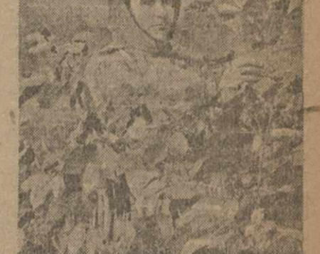
Хлопководы Армении большевистски борются за хлопок

В начале уборки хлопок сдвинулся в сторону. В период уборки хлопководы Армении большевистски борются за хлопок. Прогрессивно настроенные работники колхозов большевистски борются за выполнение хлопкового плана.