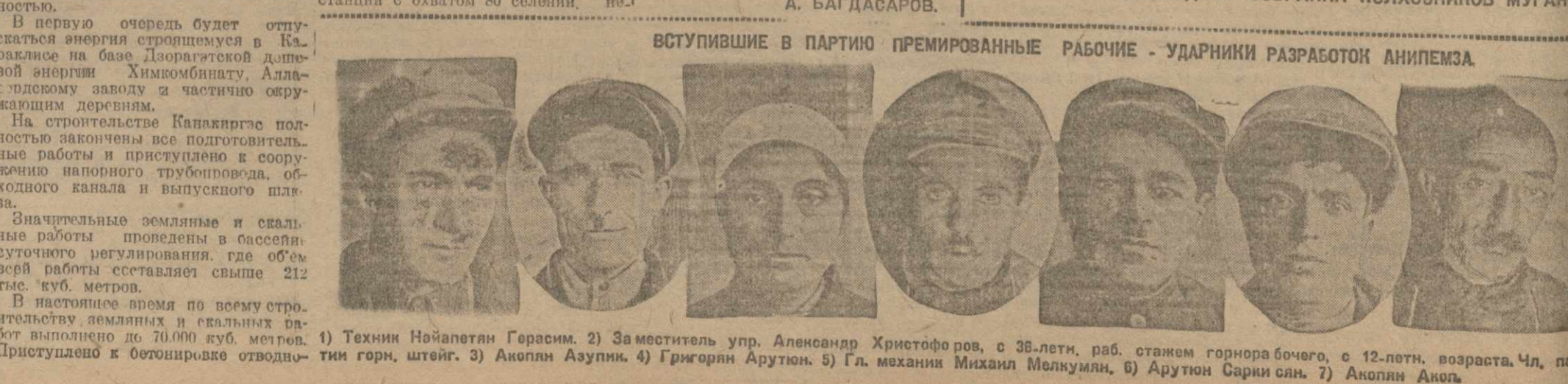
ВСТУПИВШИЕ В ПАРТИЮ ПРЕМИРОВАННЫЕ РАБОЧЕ-УДАРНИКИ РАЗРАБОТКИ АНИИМАЗА.

Современным проведением сева хлопка, своевременным приступом к обработке кампани, выполнением четырех полон междурядья, посевам мы, колхозники селения Мугань, под большевистским руководством партия армянской буржуазии обеспечили максимальную урожайность хлопка — 15,5 центнера с гектара в среднем.