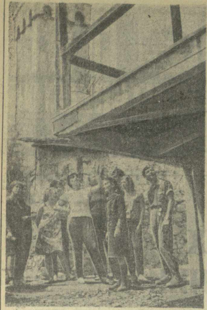
Свыше восьми тысяч туристов со всех концов страны бывают ежегодно на турбазе в Местра. Здесь они с интересом знакомятся с достопримечательностями Сванетии, ее историей и сегодняшним днем. На снимке: туристы в Местра.

В кинотеатрах: имени Руставели, «Амриани» (в зимнем театре), «Сакартвело» (Красный зал), «Ганакхиди», имени 26 комиссаров (во втором зале), «Звон», «Колхида» (в зимнем театре), «Падлавишине», «Октябрь», «Хозяин тайги», в саду филармонии, «Исания» (в зимнем театре), «Спартак», в Доме культуры имени Чкалова — «Независимость», «Милитари» (в летнем театре), «Исания» (в летнем театре), «Колхида» (в летнем театре), «Дети райка» (1-я и 2-я серии), имени 26 комиссаров (в первом зале) — «Золотые серьги» (1-я—2-я серии), «Скартелло» (Зеленый зал) — «Поэзия в камне» (1-я—2-я серии), «Скартелло» (в летнем театре) — «Новые приключения неуловимых»; имени 26 комиссаров (в летнем театре), в Доме культуры имени Плеханова (в летнем театре) — «Восстание»; «Казбег» (во втором зале) — «Пора мечтаний»; в Доме культуры имени Горького (в зимнем театре) — «Бриллиантовая рука»; в Доме культуры имени Горького (в летнем театре), «Спорт», «Колмеурне» — «Похитение девушки»; «Ганакхиди» — «Искатели приключений»; «Комсомолец» — «Безый ролль»; «Наказули», в Доме офицеров, «Казбег» (в первом зале), в парке Ваке — «Серенада большой любви»; в Доме культуры имени Плеханова (в зимнем театре) — «Мужчина и женщина»; «Батуми» — «Большие маневры».