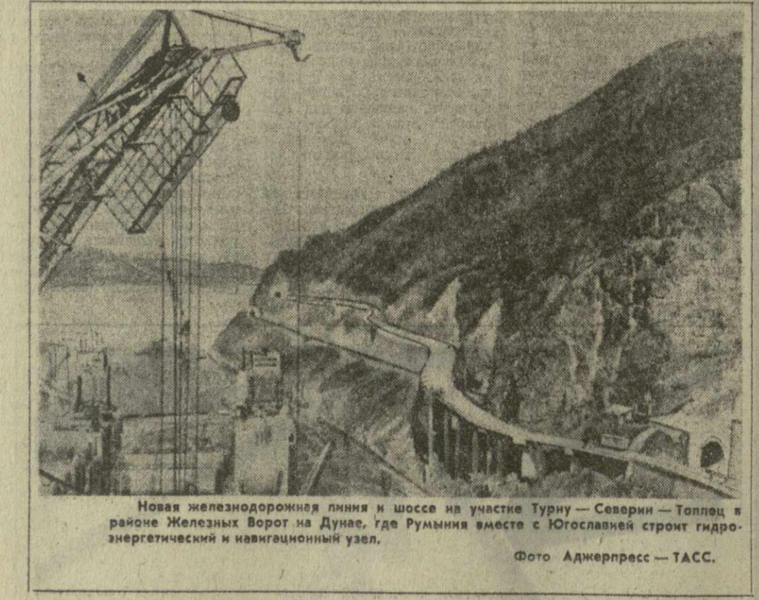
Новая железнодорожная линия и шоссе на участке Турну — Северин — Топлец в районе Железных Ворот на Дунае, где Румыния вместе с Югославией строит гидроэнергетический и навигационный узел.