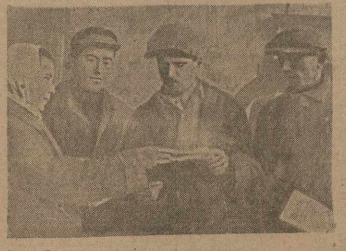
ТИФЛИС. Распространение партийной литературы на заводе им. 26 коммунаров.

МАРДАКЕРТ. (Наш. кор.). Практическая работа по учету и распределению доходов в колхозах Дзержинского района началась 30 ноября. До этого в районе проведена значительная организационно-подготовительная работа. В Мардакертском производственном совещании колхозных счетоводов совместно с активом, двухдневные семинары с мобилизованными райкомом и т.д. Весь район разбит на 6 подрайонов, в каждый подрайон направлена бригада из 2 счетоводов, агрохимика, ветеринара и одного от райкома и работников райколхозцентра. Для общего руководства в