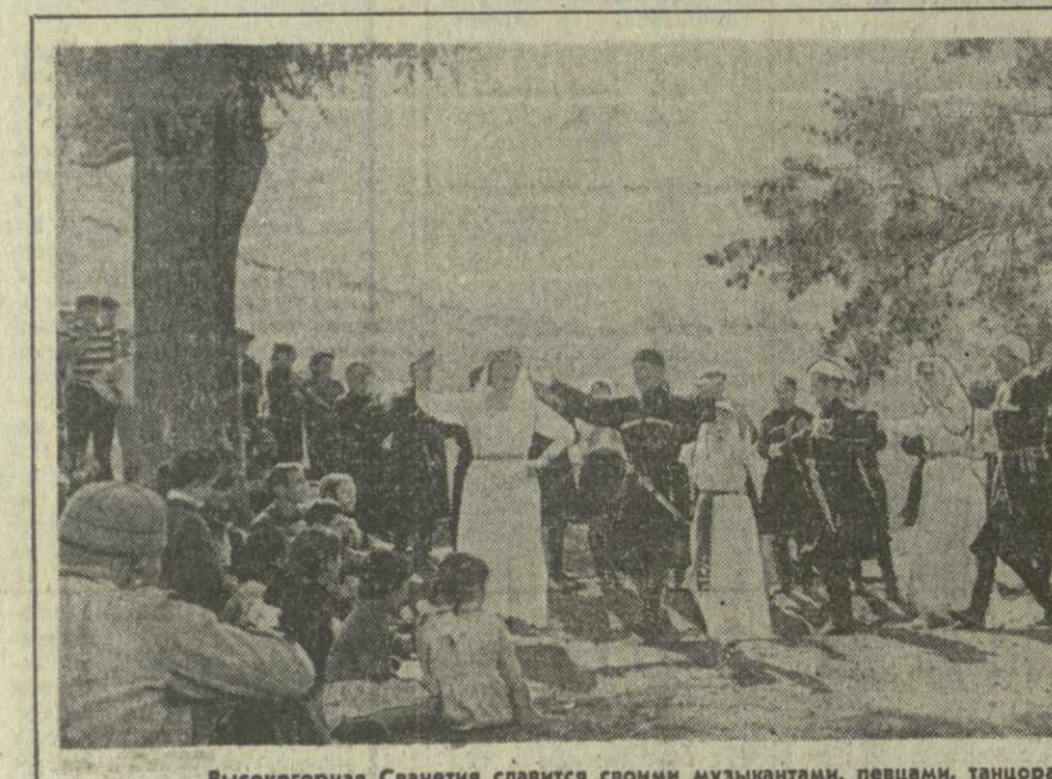
Высокогорная Сванетия славится своими музыкантами, певцами, танцорами. Колхозная самодеятельность села Латали — одна из лучших в крае. На республиканском и всеююзном смотре сванские певцы и танцоры неоднократно награждались дипломами и грамотами. На снимке: коллектив художественной самодеятельности села Латали выступает перед колхозниками.