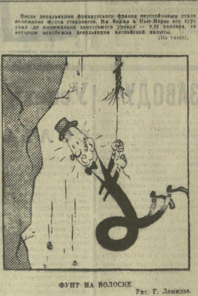
ФУНТ НА ВОЛОСКЕ Рис. Г. Ломидзе.

СЕВЕРНАЯ ИРЛАНДИЯ — ОККУПИРОВАННАЯ СТРАНА СОВЕТ БЕЗОПАСНОСТИ ОБСУЖДАЕТ ВОПРОС О ПОЛОЖЕНИИ НА БЛИЖНЕМ ВОСТОКЕ