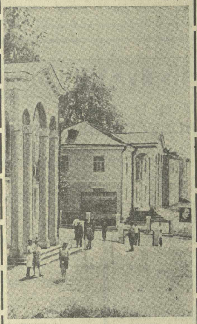
Неузнаваемо изменился облик села Нагорнари Махарадзевского района. За счет доходов колхоза-миллионера «Сакартвело» в селе осуществляется развернутый план жилищного, культурного и бытового строительства. На снимке: одна из колхозных улиц.

Комсомольцы музыкальной школы Ткибули провели вечер-концерт во Дворце пионеров и школьников имени Руставели. В зале собралось значительное количество зрителей. Программа концерта была составлена из произведений советских и зарубежных композиторов. В нем приняли участие педагоги школы и их воспитанники. Горняки тепло благодарили исполнителей и всеобщих друзей. Г. ГЕЦАДЗЕ.