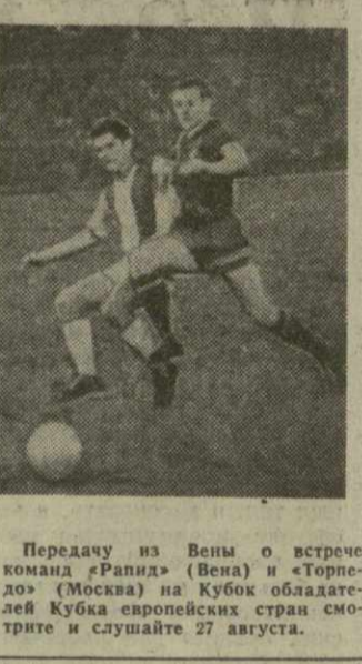
Передать из Вены о встрече команд «Ратна» (Вена) и «Торнадо» (Москва) на Кубок обладателей Кубка европейских стран смотрите и слушайте 27 августа.

Горьковского театра кукол. 16.45 — Из Москвы. Новости. 17.00 — Из Москвы. «Час Родины». 18.00 — Новости. 18.10 — Кинофильм. 18.40 — Для детей. Передача «Город Ленин». 19.10 — Концерт. 19.35 — Кубок обладателей Кубка европейских стран: «Ратна» (Вена) — «Торнадо» (Москва). Центральное телевидение с 10.55 до 13.15 и с 17.45 до 00.15.