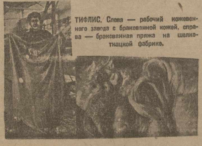
ТИФЛИС. Слева — рабочий нововведенной звезды с бракованной юбкой, справа — бракованная юбка на швейной фабрике.