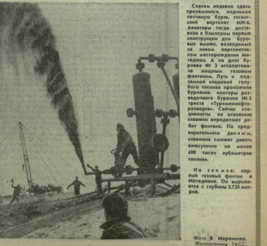
Совершенно недавно здесь приземлился, поднимая песчаную бурю, гигантский вертолет МИ-6. Аваторы тогда доставили в Изылумы первые конструкции для буровых вышек, возводимых на новом перспективном месторождении Метеджан. А на днях буровая № 3 отсаливала мощным газовым фонтаном. Путь к подземной кладовой голубого топлива проложили буровики конторы разведочного бурения № 5 треста «Туркменнефтегаз». Сейчас специалисты по освоению скважин определяют дебит фонтана. По предварительным данным, скважина сможет давать ежедневно не менее 400 тысяч кубометров топлива. На снимке: первый газовый фонтан в Метеджане. Он вырывается с глубины 2,720 метров.

Начал работу республиканский гидрометеорологический центр, созданный в Белоруссии. Одна из главных задач его — осуществление комплексной автоматизации гидрометслужбы в масштабе республики. Такая автоматизированная система создается впервые не только в Советском Союзе, но и в мире. Все процессы наблюдения, обработки материалов и их анализ, сбор и распространение метеорологической информации, в том числе со спутников погоды, будут осуществляться с помощью автоматических средств. Гидрометеорологический центр республики установит связь с гидрометцентром СССР и соответствующими службами всех континентов земного шара. (ТАСС).