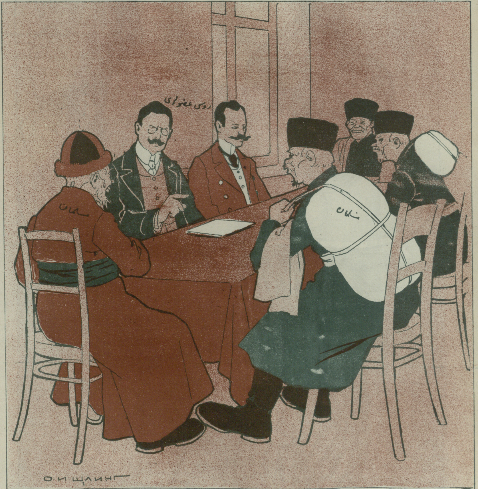
قازان شهرنده روما عضویری .