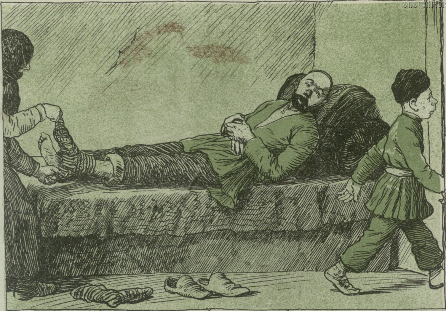
بالا دورما گیت ایشله مگد . (شکی ده)