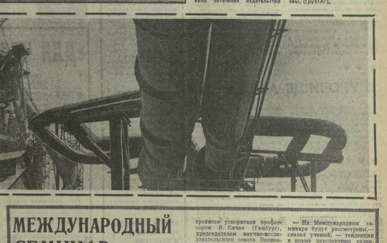
Международный семинар физиков. На снимке: доменный цех.