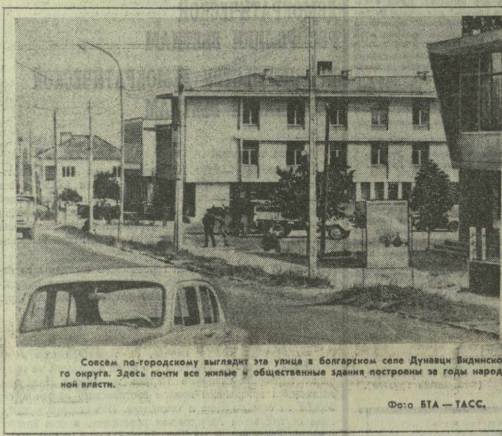
Совершенно по-городскому выглядит эта улица в болгарском селе Дунавци Видинского округа. Здесь почти все жилые и общественные здания построены за годы народной власти.

В поездке Л. Свободу сопровождал министр национальной обороны ЧССР генерал-полковник М. Дзур и государственный секретарь министерства иностранных дел В. Плескот. С польской стороны в переговорах участвовали министр иностранных дел С. Евдзиховский и министр национальной обороны генерал брони В. Ярузельский.