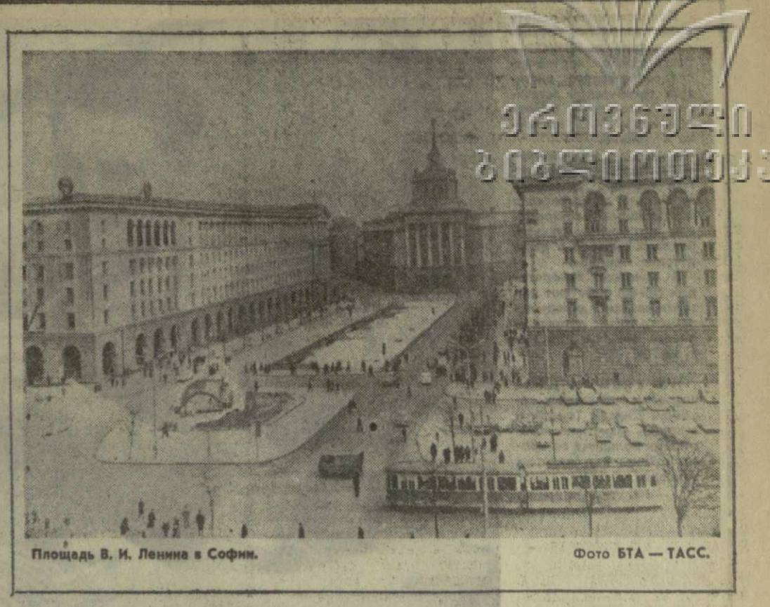
Площадь В. И. Ленина в Софии.

Экономический рост республики характеризуется убедительными цифрами. Валовой объем промышленной продукции в минувшем году по сравнению с 1967 годом возрос почти на 12 процентов. Особенно впечатляет прогресс ведущих отраслей болгарской индустрии. Например, производство электроэнергии увеличилось на 13,3 процента, выплавка стали — почти на 18 процентов. Высокого прироста продукции добились химическая промышленность, машиностроение, металлообработка.