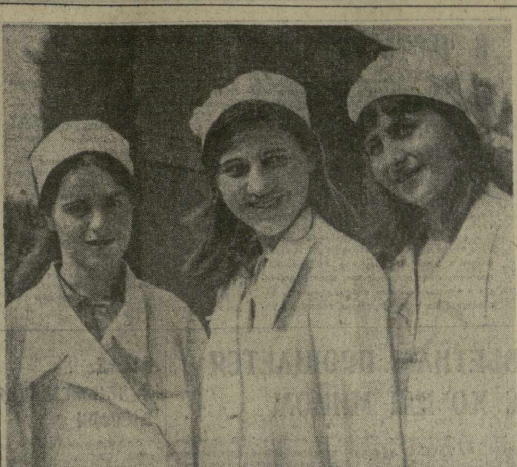
20 лет назад Гурнанская чайная фабрика Махарадзевского района выдала первую продукцию. В течение двух десятков лет коллектив предприятия добивается все новых и новых производственных успехов. За это фабрике присвоено почетное звание предприятия коммунистического труда. Она — низменный участник ВДНХ. В нынешнем году здесь будет переработано 3.000 тонн листа и выпущено 750 тонн чая.

Коллектив бригады выполняет задания на 150 и более процентов. Это позволило ему за полтора года раньше срока распорядиться о выполнении пятилетнего задания.