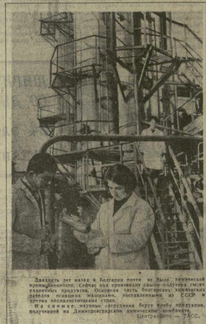
Двадцать лет назад в Болгарии почти не было земледельческой промышленности. Сейчас она производит свыше полутора тысяч различных продуктов. Основная часть болгарских химических заводов оснащена машинами, поставленными из СССР и других социалистических стран.