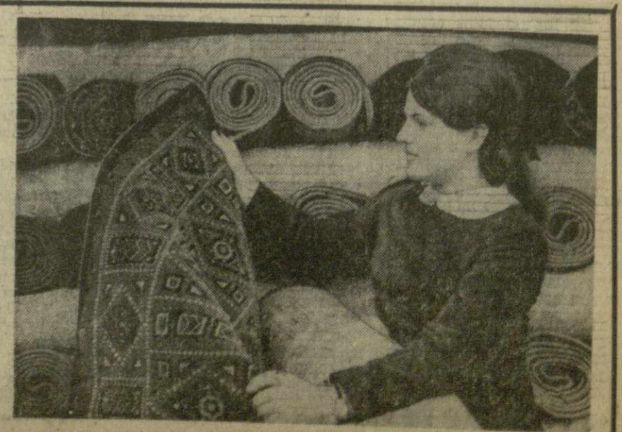
Тбилиси, 12 сентября 1969 г.

Нефтяник Черниговщины с начала года добыл сверх плана более 36 тысяч тонн нефти, 430 тонн сжиженного газа, 886 тысяч кубических метров попутного газа. На снимке: днем и ночью заполняются железнодорожные цистерны сжиженным газом на Прилукском газопроводе.