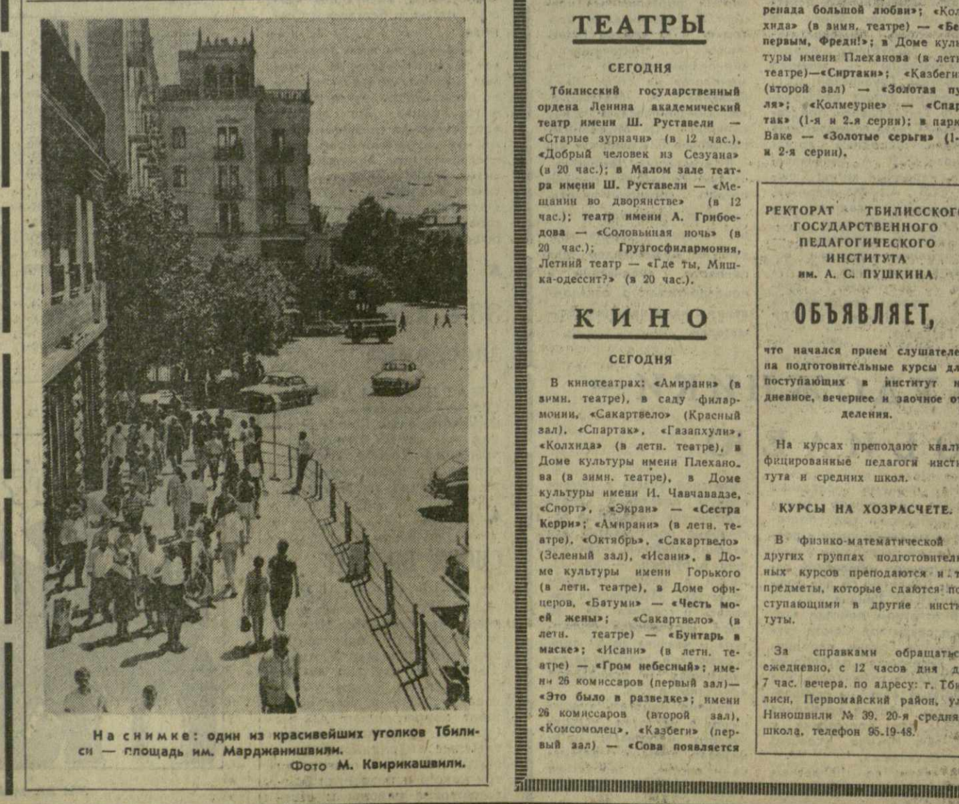
На снимке: один из красивейших уголков Тбилиси — площадь им. Марджанишвили.

Последний матч в нашей стране провели волейболистки японской команды «Нинион». В Московском Дворце спорта они встретились со сборной СССР.