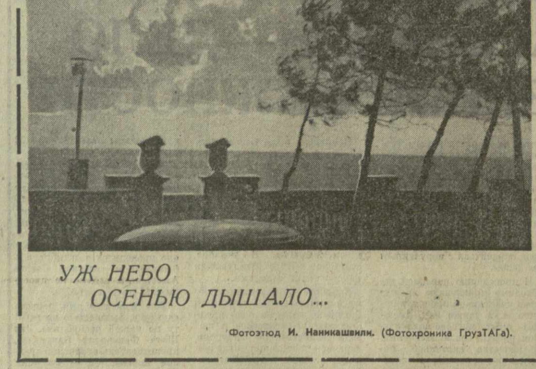
УЖ НЕБО ОСЕНЬЮ ДЫШАЛО...