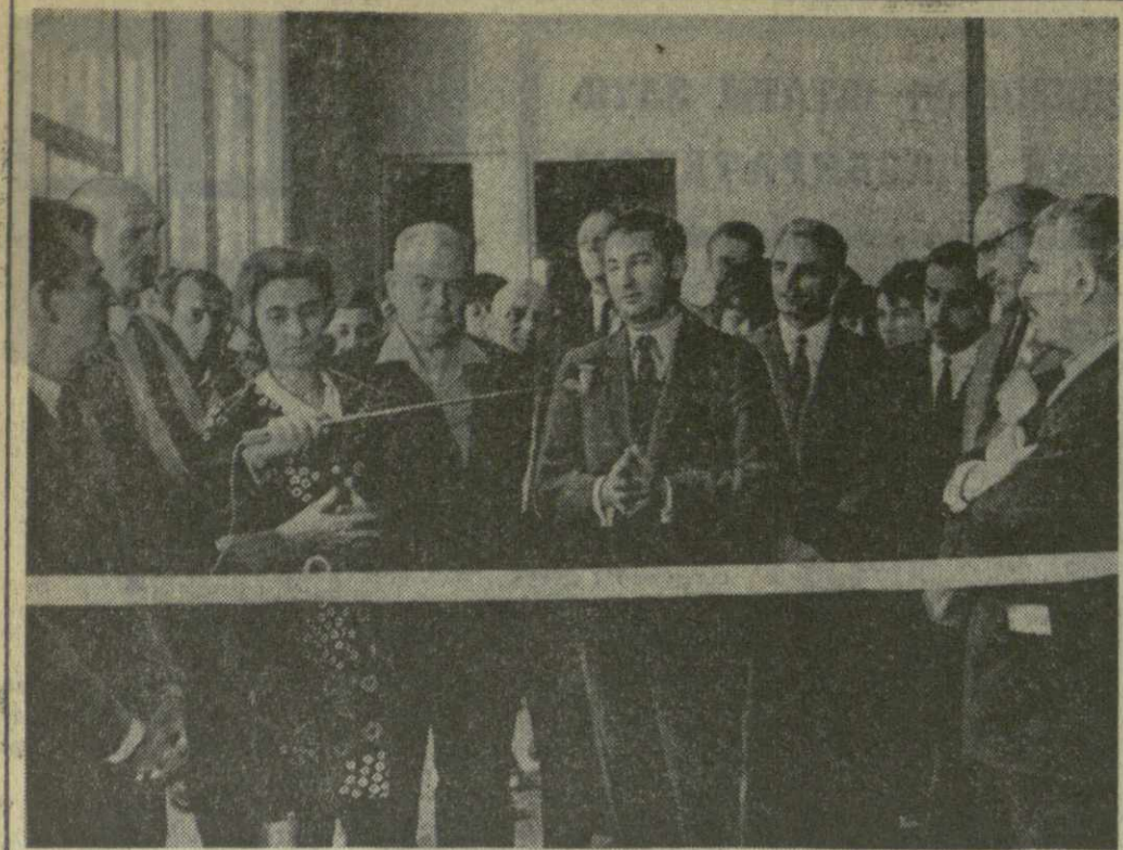
20 сентября в залах Грузинского общества дружбы и культурной связи с зарубежными странами открылась выставка французской фотографии. На снимке: открытие выставки.

чительно увеличили возможности человека. Современными достижениями науки и техники познакомит читателя серия «Биология». Если вас интересует создание новых, не являющихся в природе существ, в частности в области «Химия». А на обширной серии «Генетика» вы найдете все о наследственности и о великих озеленителях Арктики и Антарктиды, о богатствах нашей Родины. Немалую практическую помощь окажут земледельцам и животноводцам брошюры серии «Сельское хозяйство в орудиях и достижениях передовой мысли и достижении тружеников села». Что вы слышали о гомографии, о модели Вселенной? Как ведутся космические исследования в СССР? Обо всем этом расскажут вам крупнейшие советские ученые на страницах брошюр серии «Физика, астрономия». Любители точных наук не оставят равнодушными книжки, которые выйдут в сериях «Математика, кибернетика», «Радиоэлектроника и связь». Ежемесячно в каждой серии выходит одна брошюра.