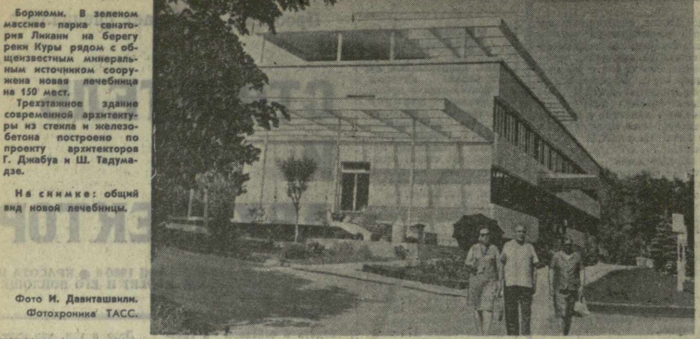
На снимке: общий вид новой лечебницы.