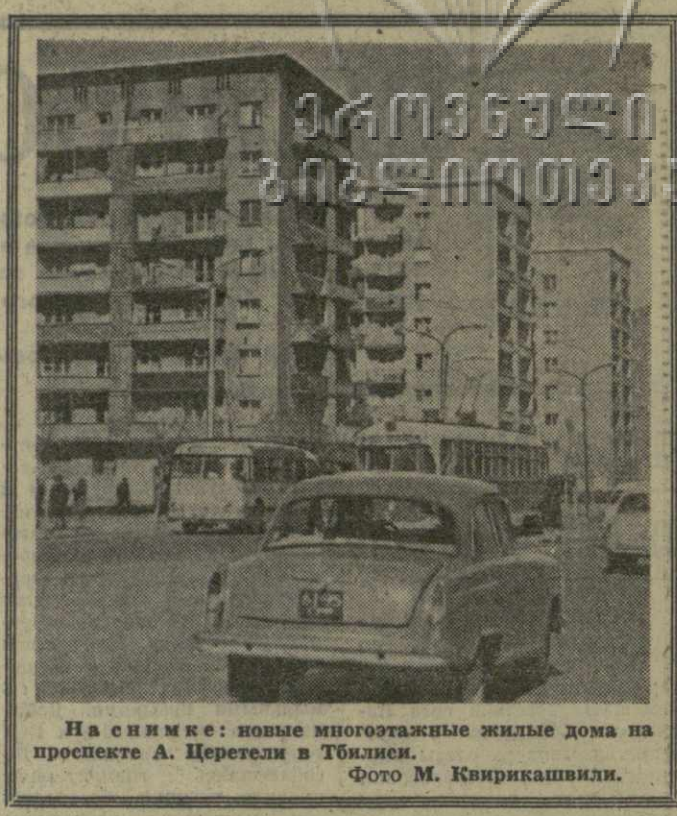
На снимке: новые многоэтажные жилые дома на проспекте А. Церетели в Тбилиси.