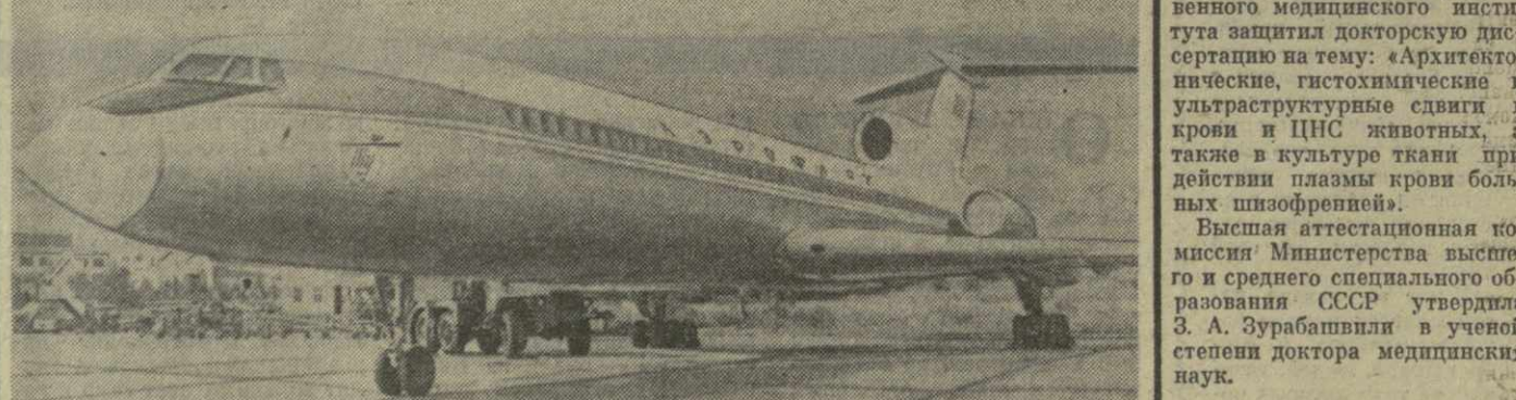
На снимке: «ТУ-154».

— В Москве, в матче на первенство страны по баскетболу армянцы со счетом 78:67 победили тбилисского «Динамо». Победил баскетболист ЦСКА — 90:67.