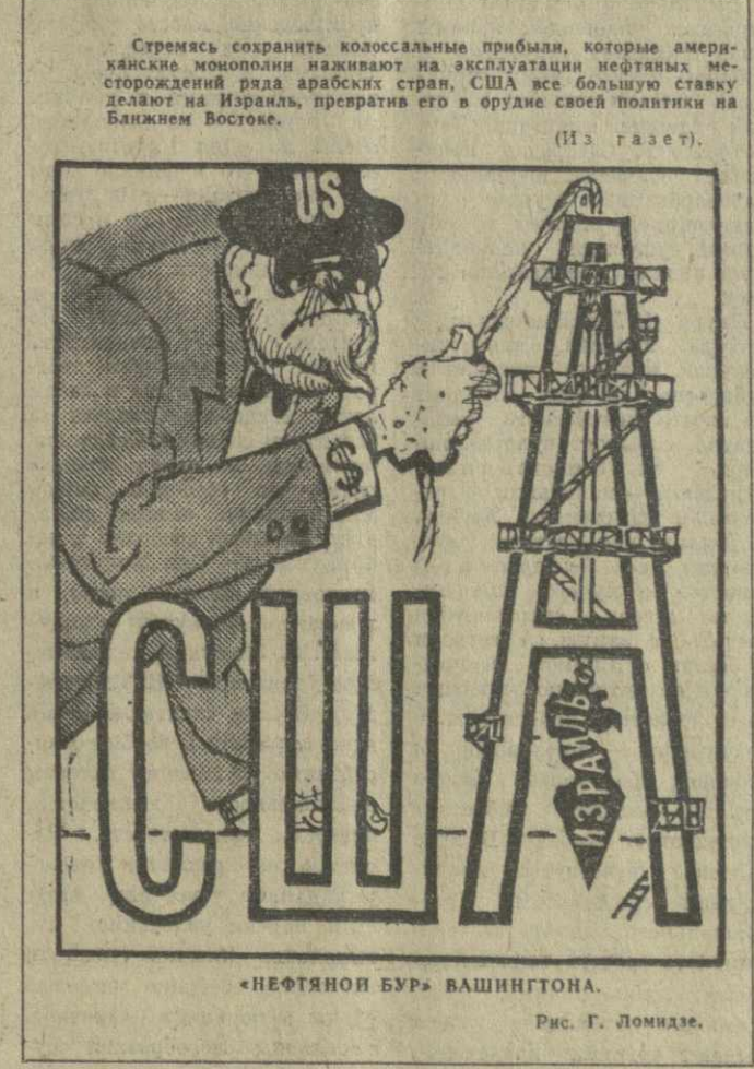
«НЕФТЯНОМ БУР» ВАШИНГТОНА.

Как сообщила газета «Жэньминь жибао», в нынешнем году в КНР предполагается созвать сессию Всекитайского собрания народных представителей (ВСНП). Хотя точный срок созыва сессии окружен глубокой тайной, иностранные наблюдатели, находящиеся в Пекине, не исключают возможность того, что она будет созвана уже в январе. ВСНП, являющееся в соответствии с конституцией 1954 года высшим законодательным органом КНР, последний раз собрался в полном составе шесть лет назад — в декабре 1964—январе 1965 года. Еще в 1968 году истек четырехлетний срок мандатов депутатов ВСНП. Председатель собрания, маршал Чжу Дэ, был еще в начале культурной революции объявлен «отступником», «военным князьком». Бесследно искали в китайской политической сцене многие из его 18 заместителей во ВСНП, значительная, если не большая часть депутатов ВСНП. Ныне, судя по сообщениям из Пекина, китайское руководство намерено «возродить» ВСНП, чтобы от его имени одобрить те перемены, которые произошли в стране в результате «культурной революции». На сессии, возможно, будет объявлено о новом главе государства (председателе КНР Лю Шао-ци, как на-