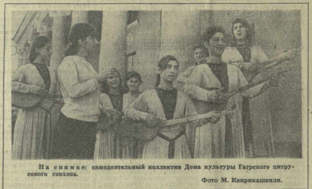
На снимке: самодеятельный коллектив Дома культуры Гагрского цитрусового совхоза.