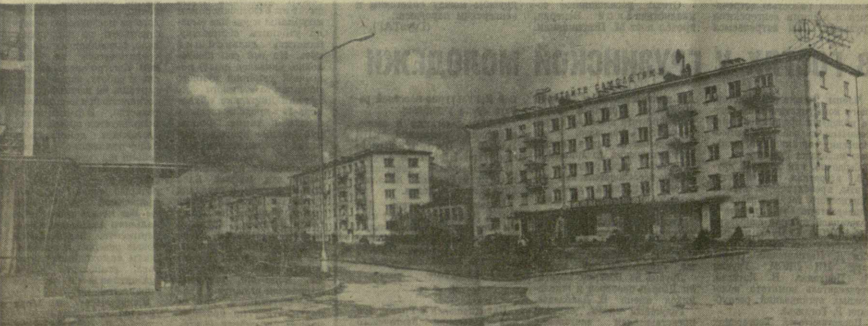
Сухуми — город-порт, город-курорт, город научных учреждений и промышленных предприятий — растет и ширится. С каждым годом вступают в строй новые здания.

Сейчас сухумские швейники, работяки о расширении ассортимента продукции, начали выпускать платья и халаты новых фасонов.