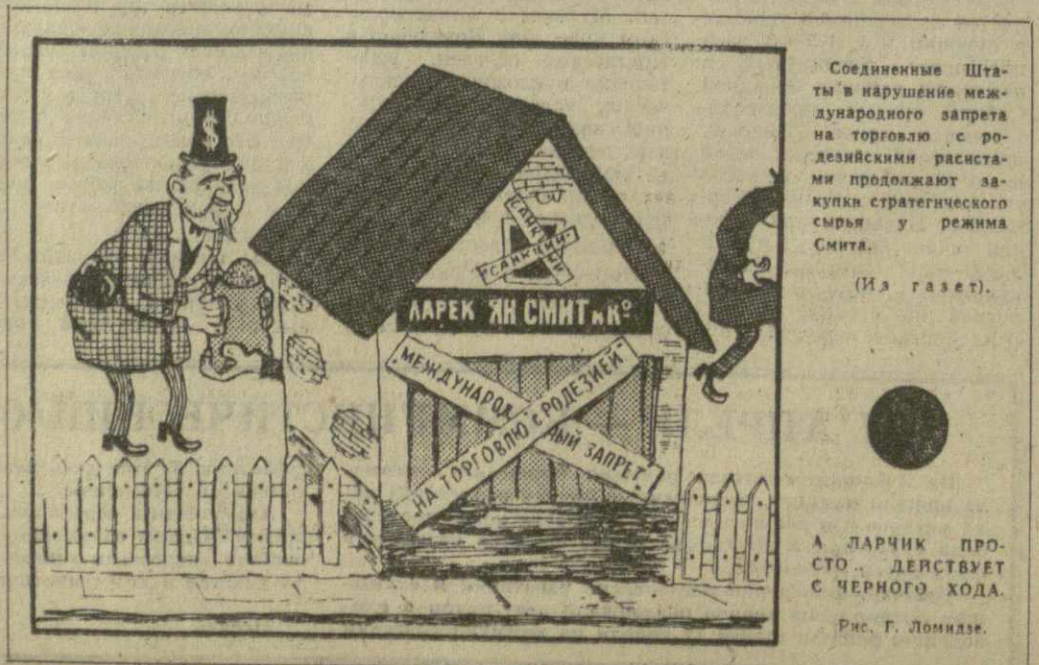
А ЛАРЧИК ПРОСТО ДЕРЖАЕТСЯ С ЧЕРНОГО ХОДА. Рис. Г. Ломыре.