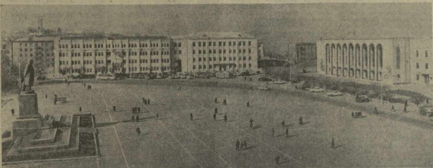
Махачкала. Площадь имени Ленина.