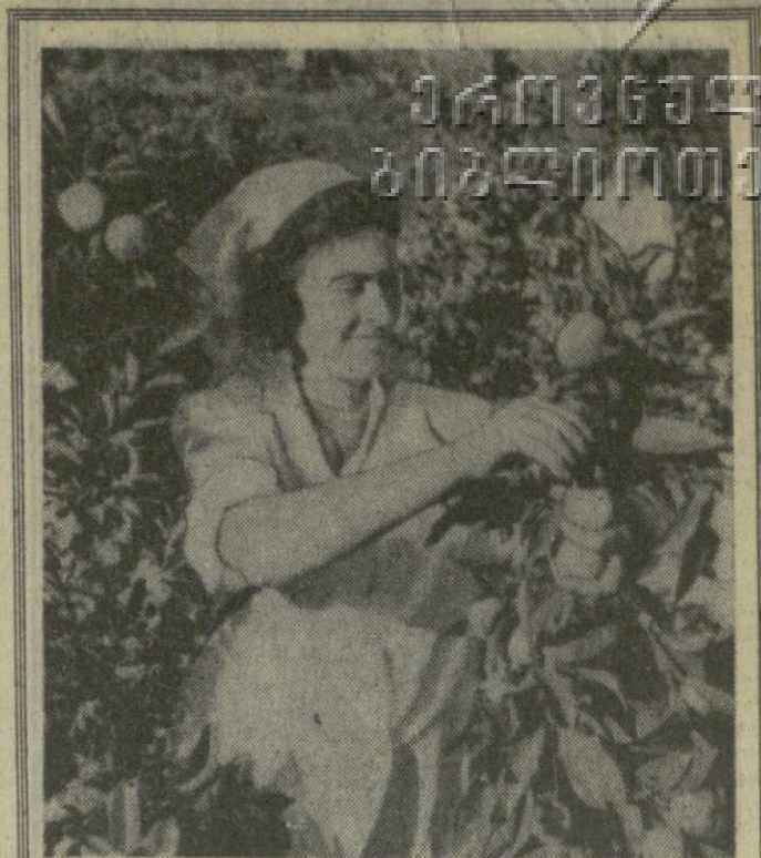
В Махиджаурском цитрусовом совхозе Хелвачурского района завершен сбор урожая. Работники хозяйства почти вдвое перевыполнили плановое задание.