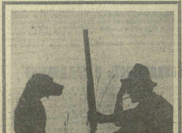
Конкурс «Зари Востока» «ПРИВАЛ».

В новых классных комнатах студенты уже начали готовить дипломы и курсовые работы.