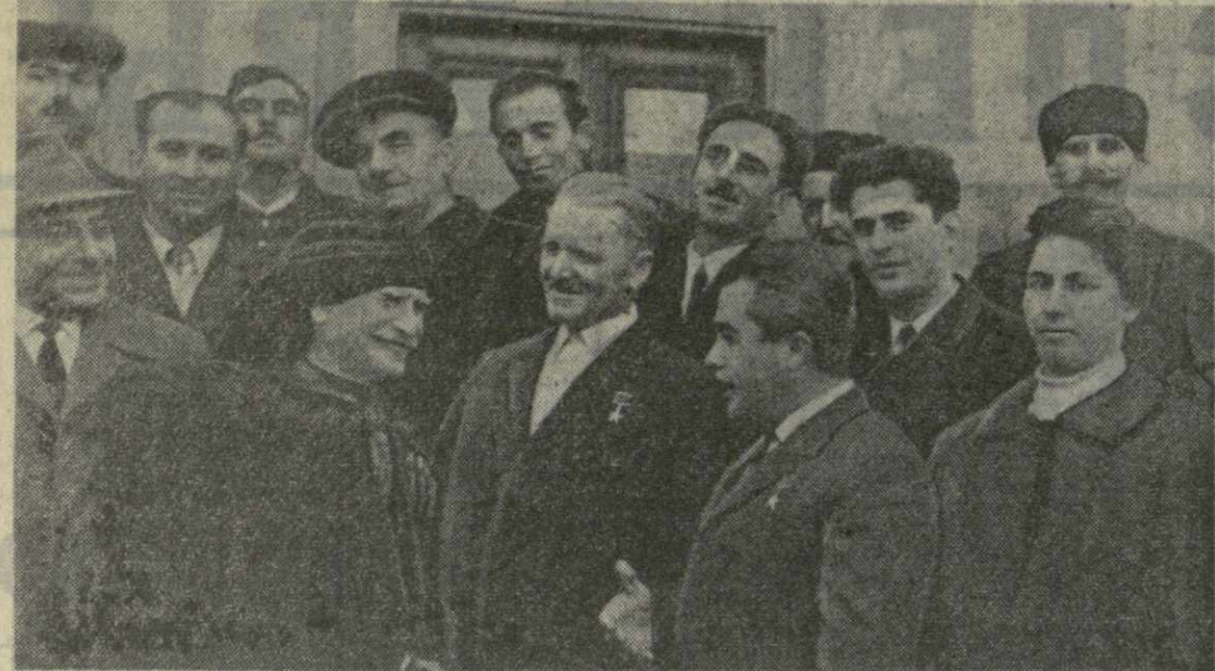
Вчера в клубе имени Плеханова состоялся вечер-встреча рабочих и служащих Ленинского района с делегатами III съезда колхозников Грузии — представителям колхозов Аджарии, Абхазии, Юго-Осетии и Душетского района. На снимке: дружеская беседа во время перерыва.