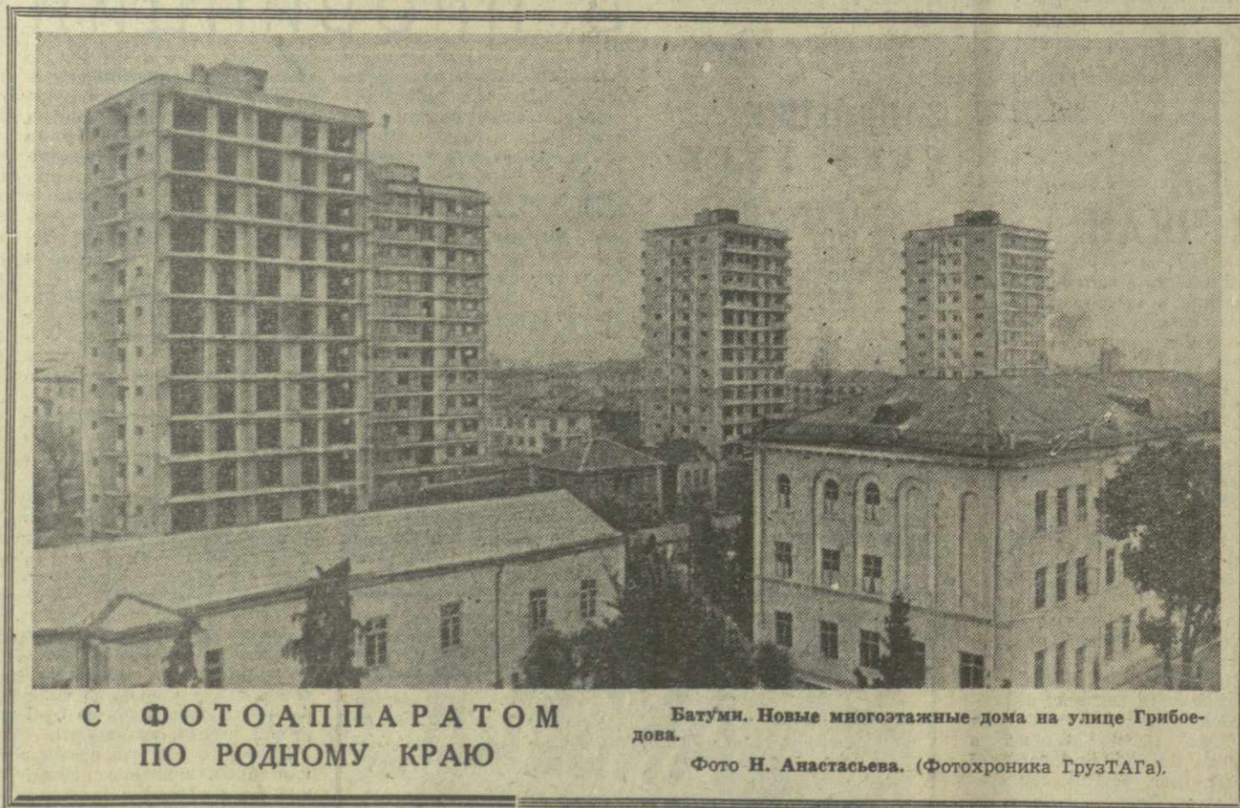
С ФОТОАППАРАТОМ ПО РОДНОМУ КРАЮ. Батуми. Новые многоэтажные дома на улице Грибоедова.

Сейчас Закавказская железная дорога — первая в стране, закончившая электрификацию магистральной линии.