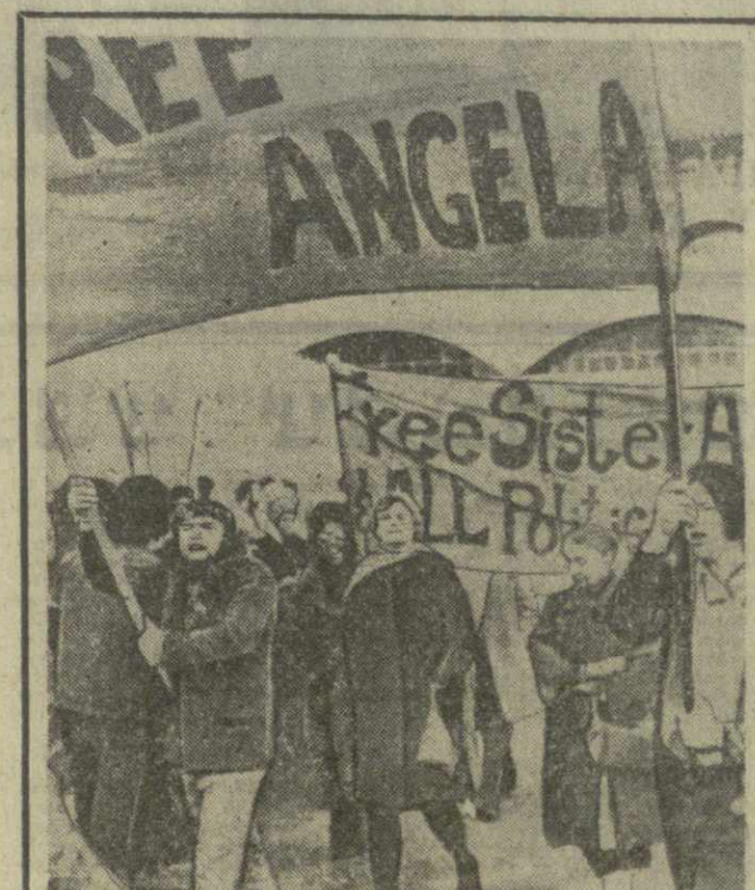
США. Лозунг «Свободу Анджелям» стал основным для всей прогрессивной Америки. Люди разного возраста и цвета кожи, разных политических взглядов и профессий встали на защиту мужественного борца за гражданские права негров.

Президент Гвинеи остановился, в частности, на ряде проблем, вставших перед страной после империалистической агрессии, которой Гвинея подверглась в ноябре прошлого года.