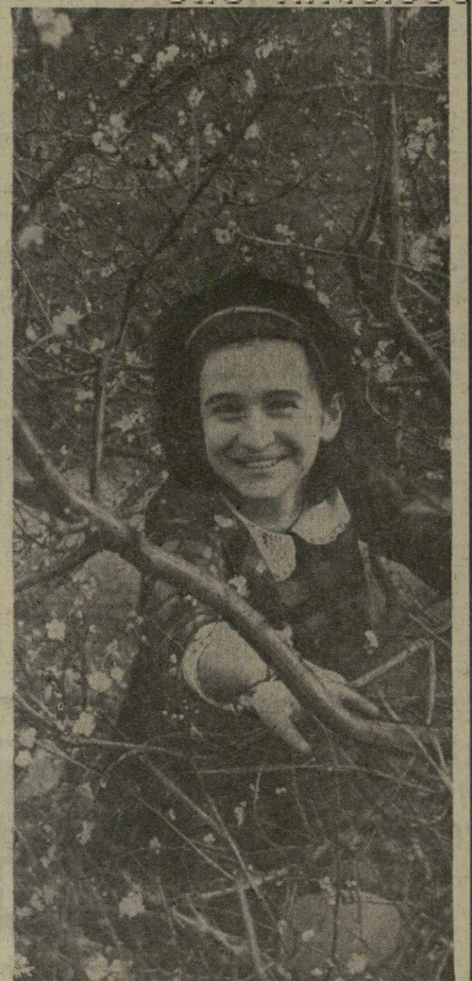
По календарю — январь, и по ночам морозит, а в Сахарском районе цветет тюльпан...