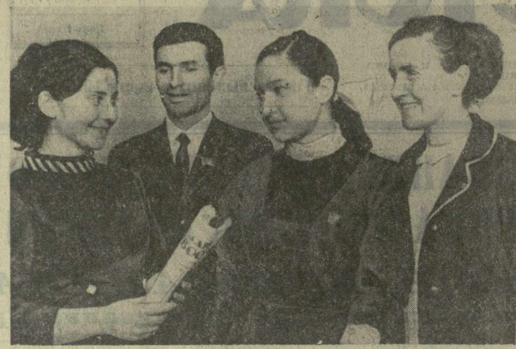
29 января в зале заседаний Верховного Совета Грузинской ССР состоялось собрание актива комсомольской организации Грузии.