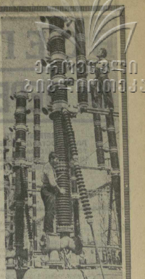
На снимке: сборка воздушных выключателей VI блока Тбилисской ГРЭС.

(Из Призывов ЦК КПСС к 52-й годовщине Великой Октябрьской социалистической революции).