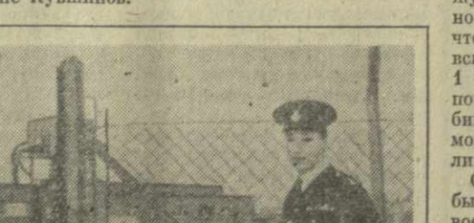
Иди Амин, глава военного правительства Уганды.