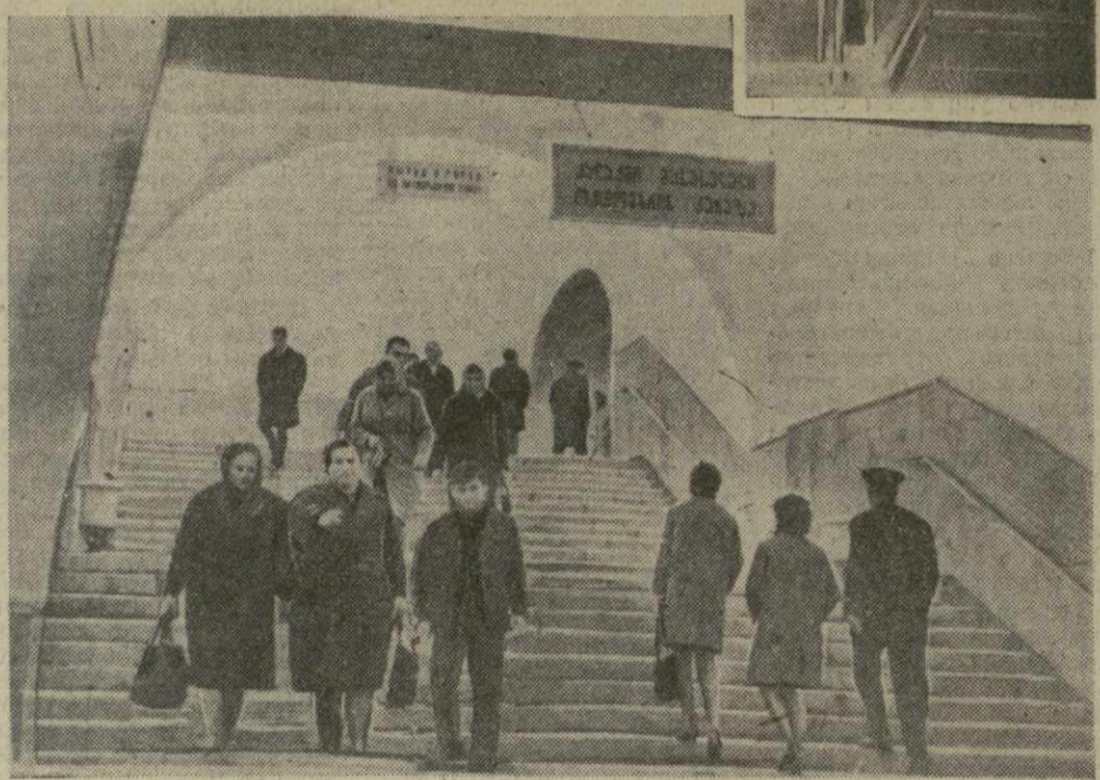
На снимках: сверху — эскалатор переходного тоннеля, внизу — выход из станции метро «Площадь Вокзальная» на Октябрьскую улицу. Фото М. Квирикашвили.

Сейчас метростроители готовят к сдаче второй путь метрополитена на участке «Площадь Вокзальная» — «Электродовская», который будет введен в эксплуатацию к концу года. Полным ходом ведутся также работы по сооружению нового участка Тбилисского метро от станции «300 армянцев» к станции «Навтули». Начаты работы и по освоению строительных площа-