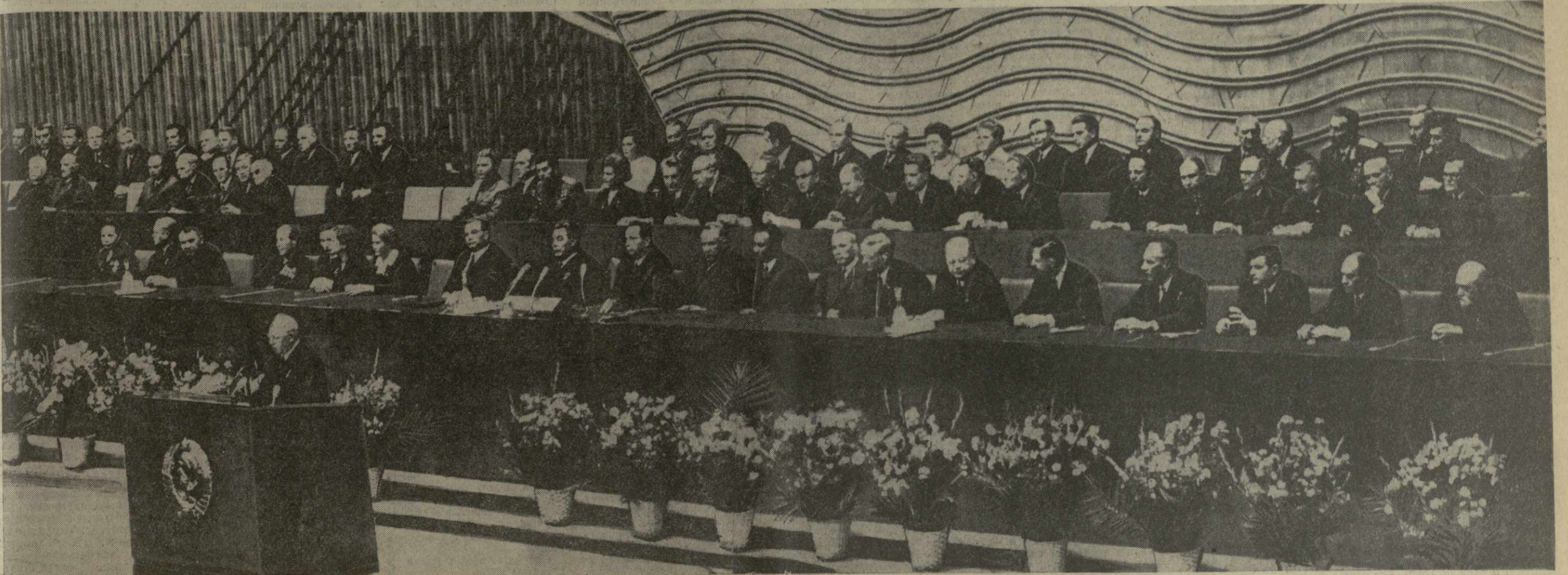
Москва, Кремлевский Дворец съездов. 6 ноября 1969 года. В президиуме торжественного заседания, посвященного 52-й годовщине Великой Октябрьской социалистической революции. Фото ТАСС. (Принято по фототелеграфу ГрузТАГ).

1969 год 7 НОЯБРЯ, ПЯТНИЦА • № 260 (13511) • 48-й год издания • Цена 2 коп.