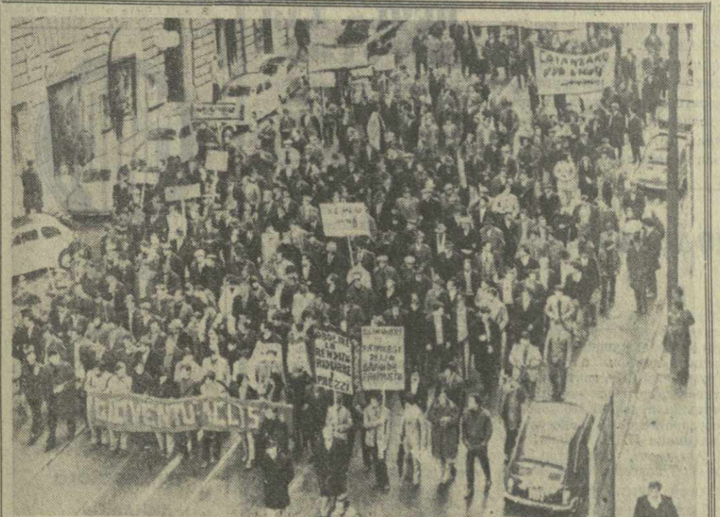
Рим. «Да здравствует земельная реформа!» «Крестьяне не хотят умирать с голоду» — с такими лозунгами прошли по центральным улицам и площадям итальянской столицы многочисленные колонны крестьян, съехавшихся в столицу со всех концов страны. Земледельцы срочно приняли законопроект о реформе системы аренды земельных участков.