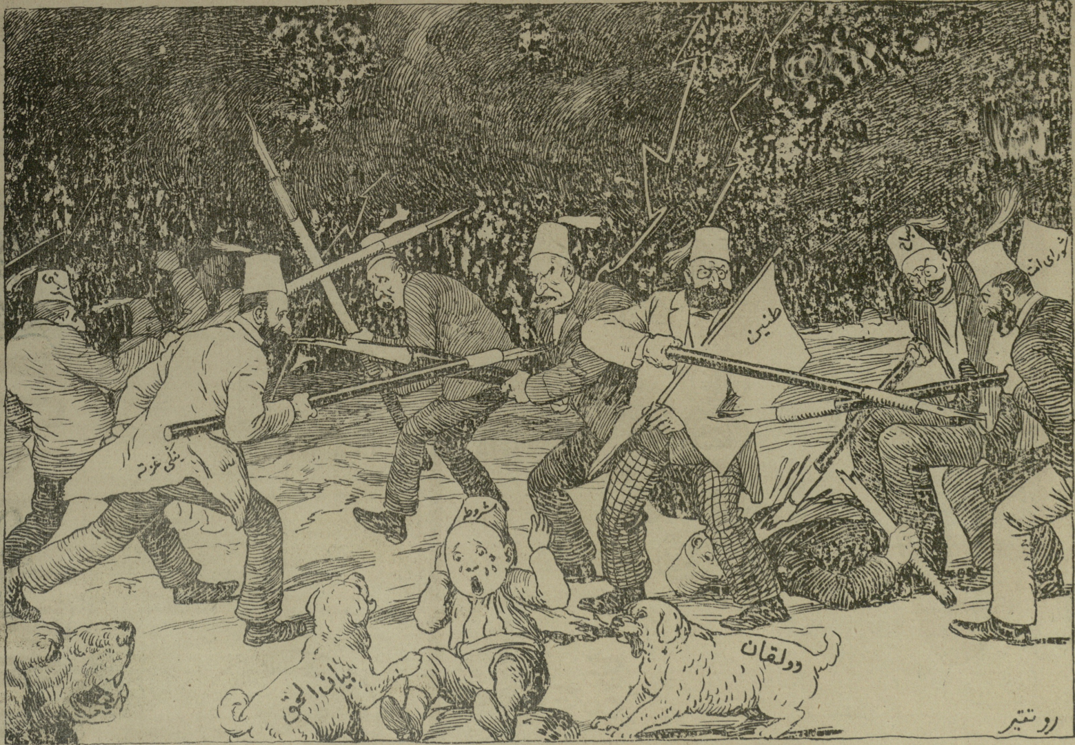
Молодая Турция и турецкая пресса.