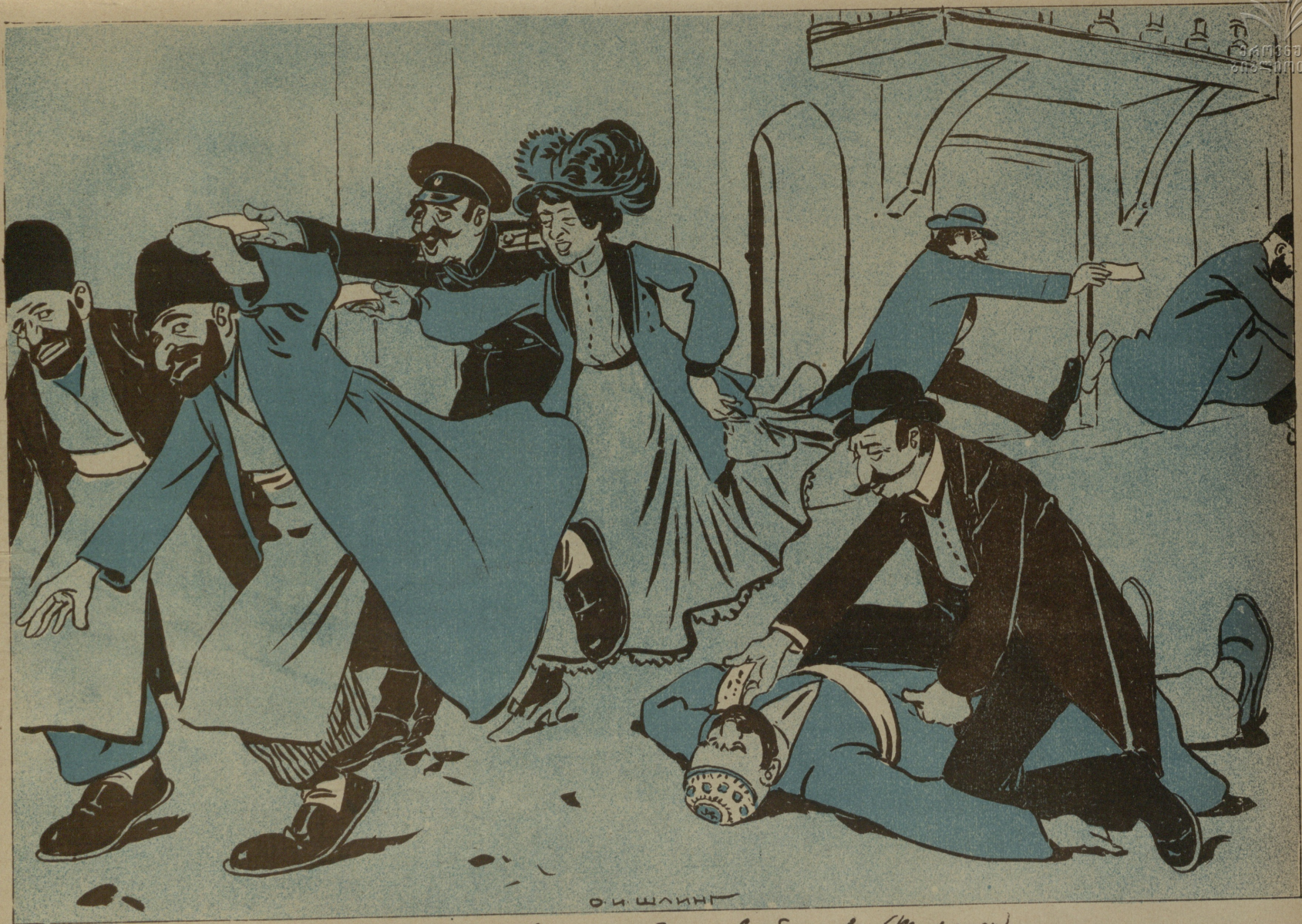
Продажа билетов на спектакли в пользу благотв. общества (Тифлис)

تفليس ده شيطان بازارده جمعيت خيره عضولرى مسلمانلاره تياتر بيليتى ساتيرلار .