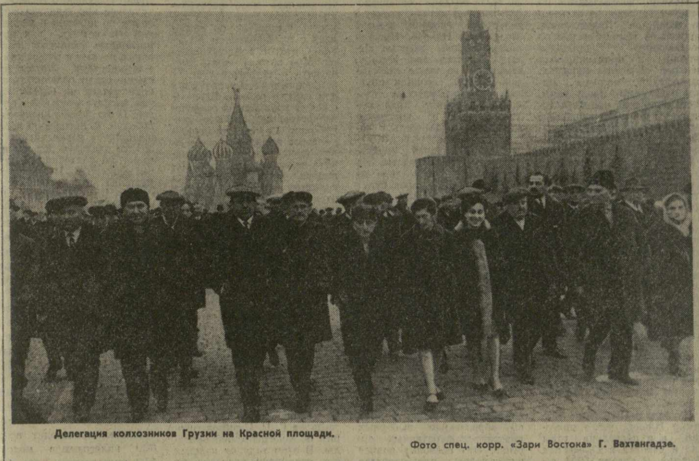
Делегация колхозников Грузии на Красной площади.

1969 год 27 НОЯБРЯ, ЧЕТВЕРГ • № 276 [13527] • 48-й год издания • Цена 2 коп.