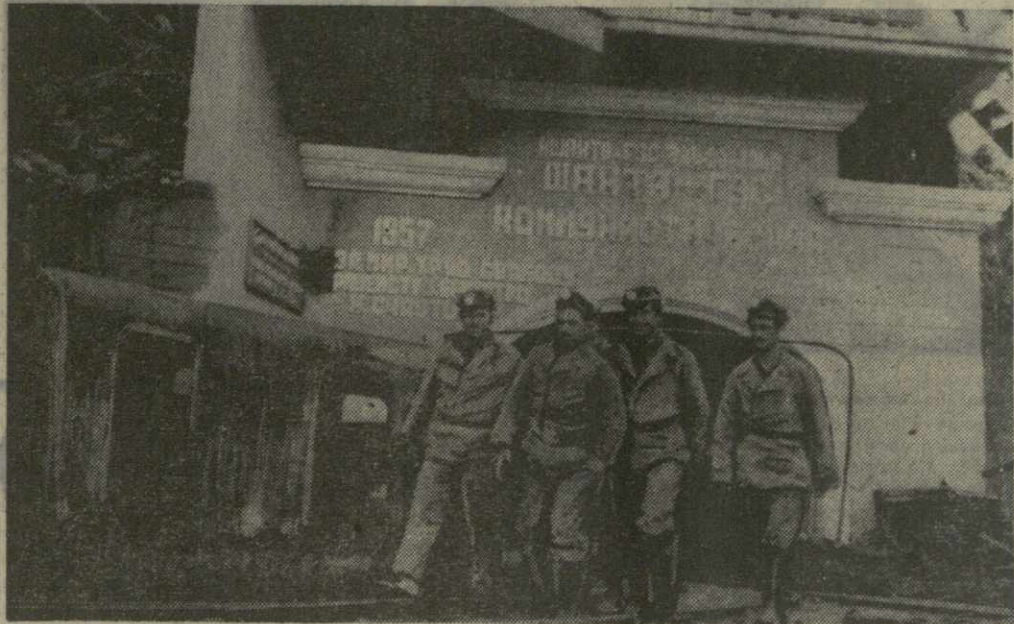
Ткварчельская шахта № 8 — одна из крупных новостроек минувшей пятилетки, сооруженная в соответствии с Директивами XXIII съезда КПСС коллективом треста № 7 «Грузшахтострой».

На снимке: портал откаточной штольни шахты.