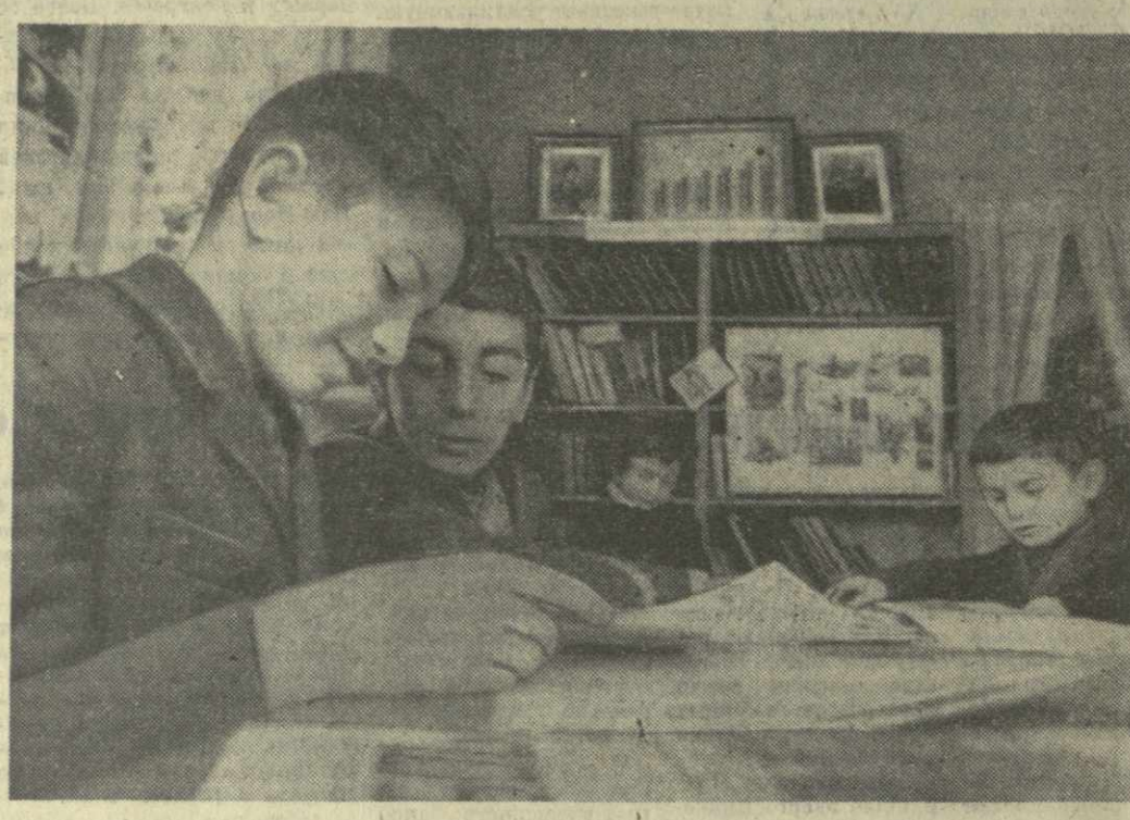
На снимке: юные читатели пришли в детскую библиотеку.