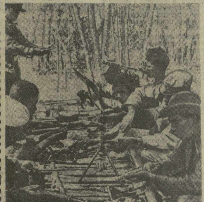
С оружием в руках стойко сражается народ Анголы за освобождение страны от португальских колонизаторов. Хорошо вооруженные и обученные отряды армии, организованной и руководимой МПЛА (Народное движение за освобождение Анголы), совершают смелые операции против врага. На снимке: чистка и проверка оружия в одном из отрядов МПЛА.