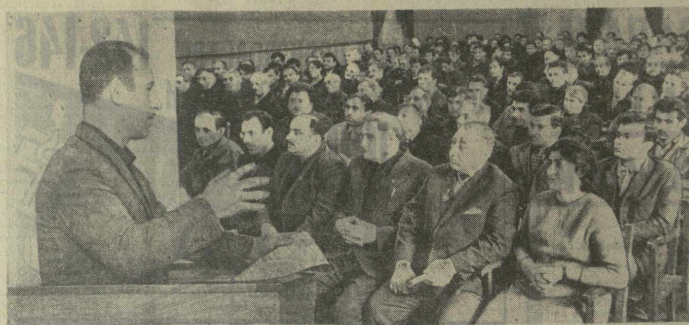
С большим подъемом прошло объединенное собрание партийных организаций восьмого механического и второго сборочного цехов Тбилисского станкостроительного завода имени С. М. Кирова, посвященное обсуждению проекта Директив XXIV съезда КПСС по новому пятилетнему плану. Кировцы выдвинули много интересных предложений, направленных на дальнейший подъем эффективности производства.

Только в январе нынешнего года на исправление брака, допущенного литейщиками, было израсходовано 1,200 нормо-