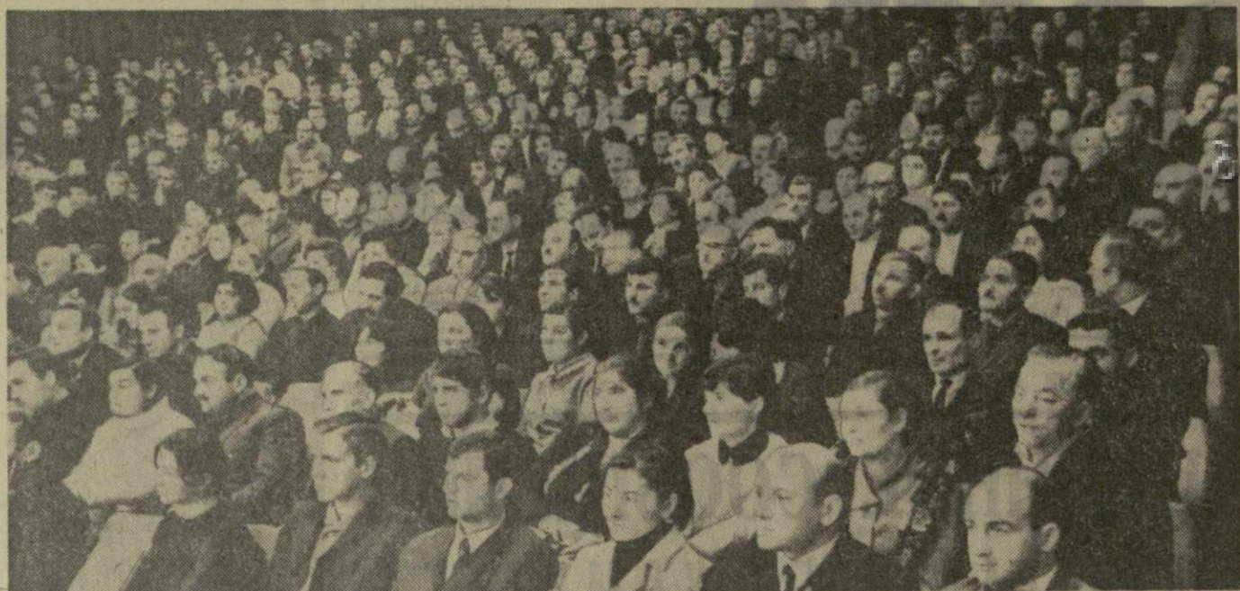
НА СНИМКЕ: ЗАЛ ЗАСЕДАНИЙ. ВНИМАТЕЛЬНО СЛУШАЮТ СОБРАВШИЕСЯ ВЫСТУПЛЕНИЯ СВОИХ ТОВАРИЩЕЙ ПО ТРУДУ.