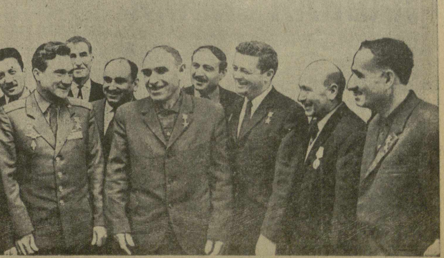
Теплой и сердечной была встреча участников слета с летчиками-космонавтами СССР Героями Советского Союза А. В. Филиппенко и В. И. Волковым. На снимке: герои космоса — среди участников слета.

● Включившись во всесоюзное социалистическое соревнование, став на Ленинскую трудовую вахту, трудящиеся столицы нашей республики полны решимости завершить пятилетку к 7 ноября 1970 года, а задание по росту производительности труда — ко дню Ленинского юбилея. ● Мы призываем всех трудящихся города широко поддерживать патриотический почин передовиков производства — 22 апреля 1970 года работать на экономном сырье и материалах. ● Большую помощь мы ожидаем от ученых, которые призваны пропагандировать знания, последние достижения науки и техники, активно содействовать техническому прогрессу, крепить связь с производством. ● Мы призываем всех тружеников нашего города каждый предъюбилейный день объявить ударным днем, днем Ленинской трудовой вахты. ● Горячо поддерживая почин москвичей, мы призываем всех трудящихся Тбилиси принять активное участие в подготовке и проведении коммунистического субботника 11 апреля 1970 года, организовать в этот день повсеместно высокопроизводительную ударную работу, показать высокие образцы труда. ● Участники городского слета передовиков производства заверяют Центральный Комитет Коммунистической партии Грузии в том, что трудящиеся Тбилиси, воспитанные на славных революционных и трудовых традициях, всегда шли и будут идти в передовых рядах борьбы за строительство коммунистического общества.