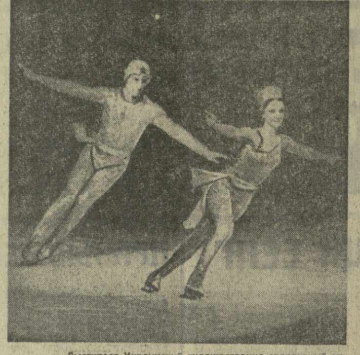
Выступает Украинский художественно-спортивный ансамбль «Балет на льду».

Кисти Э. Мирянашвили, надо сказать, что он хорошо справился с этими трудностями. Бархатный баритон певца прекрасно звучал во всех регистрах.