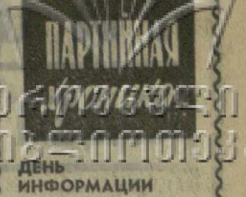
ДЕНЬ ИНФОРМАЦИИ В СУХУМИ

Вот нам и приходится все время упорно работать, ругаться, «проталкивать» свои заявки. Где уж тут думать о создании зимнего запаса,