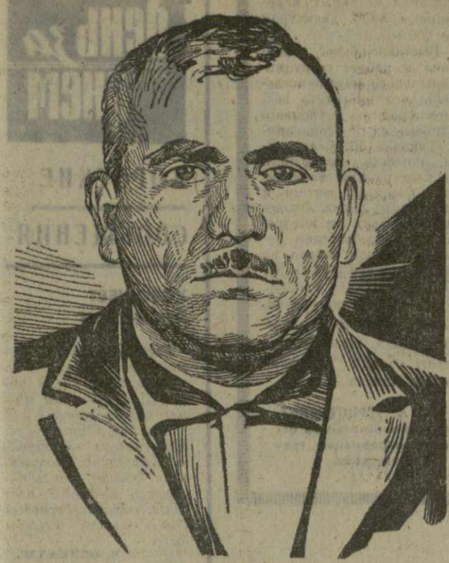
Р. Гюшвили. Рис. Н. Кузьмина.

М. АЛАЗНЕЛИ, с. Шила Кварельского района.