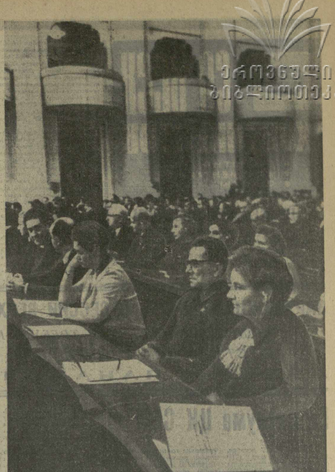
В зале заседаний Верховного Совета СССР.

На этом сегодняшнее заседание Совета Национальностей закончилось. (ТАСС).