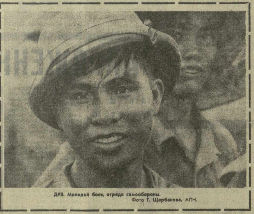
ДРВ. Молодой боец отряда самообороны.

Многолюдную аудиторию собирали выступления государственного ансамбля песни и танца «Пирин» Благоевградского округа. С его искусством познакомилась участница вечеров дружбы и концертов, проходивших во Дворце культуры Батумского нефтеперерабатывающего завода, в драматическом театре имени Ильи Чавчавадзе, в Домах культуры сел Ахалени и Цислапа Батумского района, Бобовкати Кобулетского района, Чакского чайного совхоза имени Ленина. Особым успехом пользовались в исполнении артистов ансамбля песни «Батуми» — Благоевград. Автор текста и музыки — болгарский композитор Дм. Ягелар. В дни пребывания болгарских друзей в батумском театре «Блудис» была проведена Неделя болгарских художественных фильмов. Делегация Благоевградского округа выехала в Тбилиси.