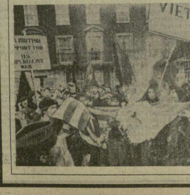
На снимке: участники демонстрации сменяют американский флаг у посольства США. Надпись на плакатах гласит: «Англия должна прекратить поддержку империалистической войны, которую ведет Соединенные Штаты».

Институты истории партии при ЦК Компартии Азербайджана, Армении и Грузии — филиалы Института марксизма-ленинизма при ЦК КПСС проводят научную сессию «Торжество ленинской национальной политики в Закавказье», посвященную 100-летию со дня рождения В. И. Ленина. Сессия начинается 23 декабря 1969 года в 11 часов в зале заседаний ЦК КП Грузии (Тбилиси, улица Читадзе, № 2).